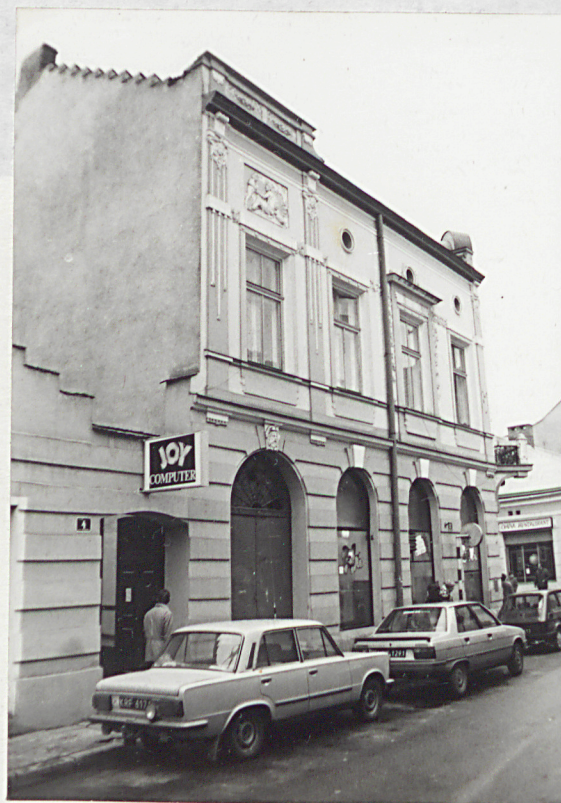
elewacja od ul. Sobieskiego