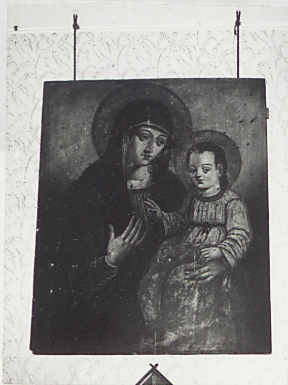
obraz M.B. z Dzieciątkiem w mieszkaniu właścicielki

3. Zawartość wkładki (nazwa obiektu lub materiału uzupełniającego) Fot. dodatkowe.