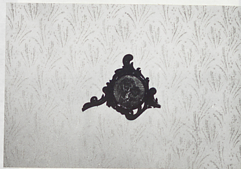
fragment szczyliku kredensu aptecznego