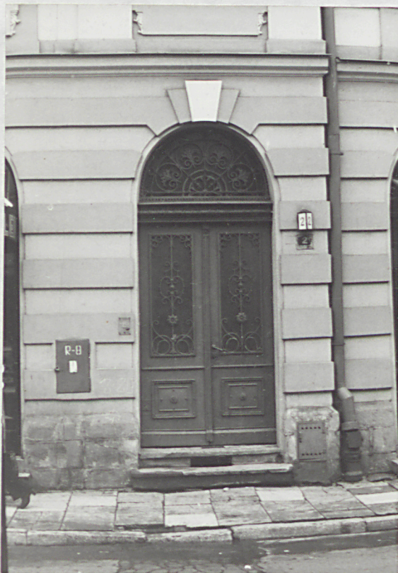
wejścia do sieni w elewacji od Lwowskiej