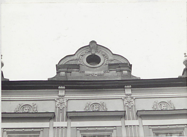
frontony nad elewacją od ul. Lwowskiej