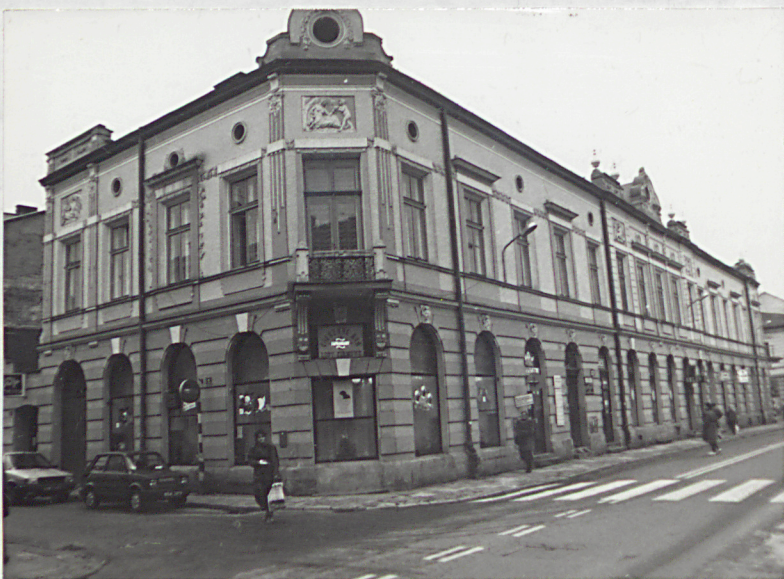
widok od płn-wsch. / od Lwowskiej /

Instalacje . Budynek posiada instalację elektryczną, wodnokanalizacyjną i gazową.