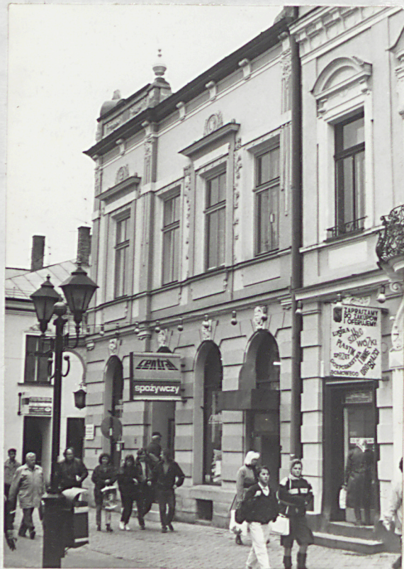
elewacja od ul. Jagiellońskiej

3. Zawartość wkładki (nazwa obiektu lub materiału uzupełniającego) Fot. dodatkowe.