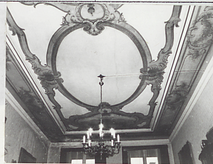
dekoracja malarska sufitu