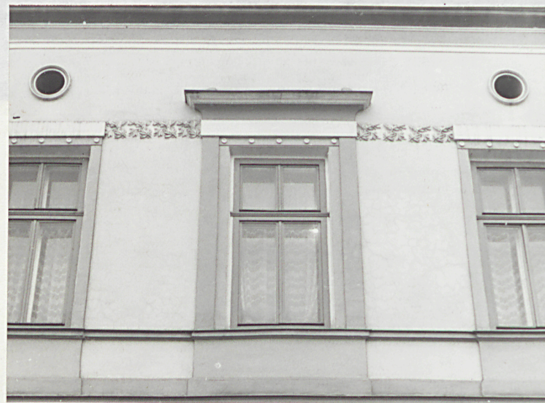
detal architektoniczny elewacji

Wkładkę złożył: mgr M.H.Grabski XI 1993 r. (imię, nazwisko, data)