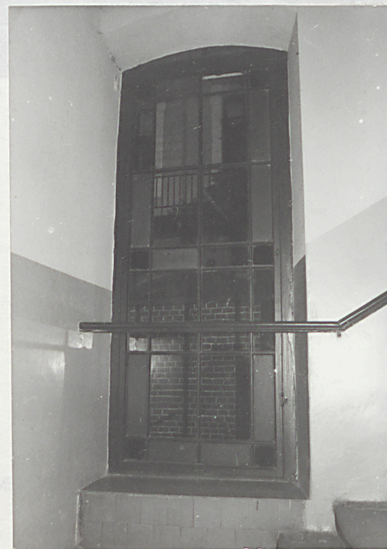
okno w klatce schodowej