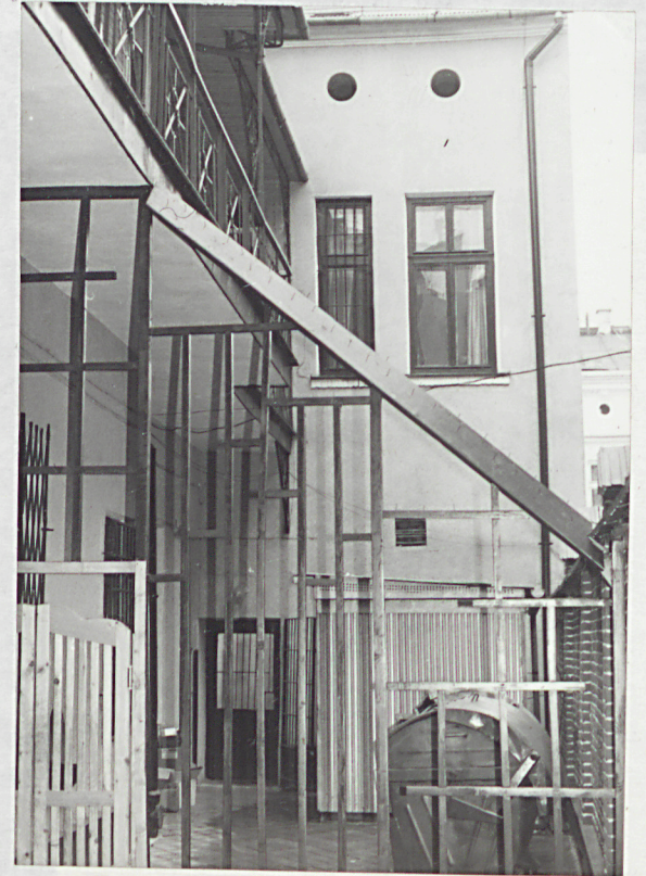
elewacje wokół wewnętrznego podwórza