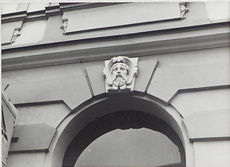
główki w nadprożach otworów parteru