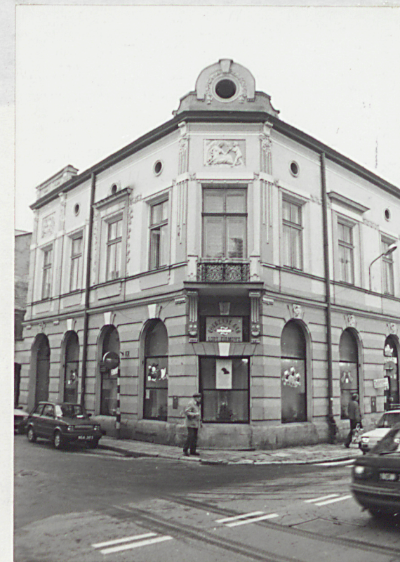
narożnik budynku ul. Sobieskiego / Lwowska