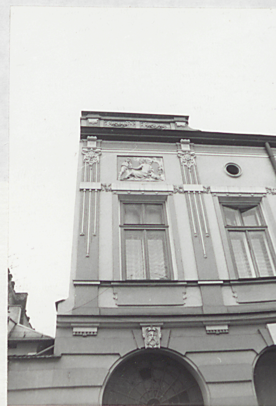
detal architektoniczny elewacji