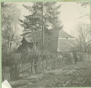
FOT. 1968 (3)