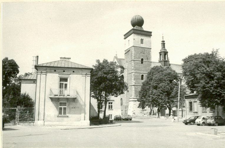
WIDOK OD STRONY PL. KOŚCIUSZKI