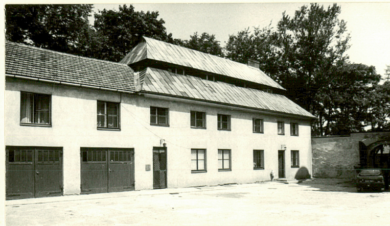
WIDOK OD PD. NA DOM DLA KSIĘŻY