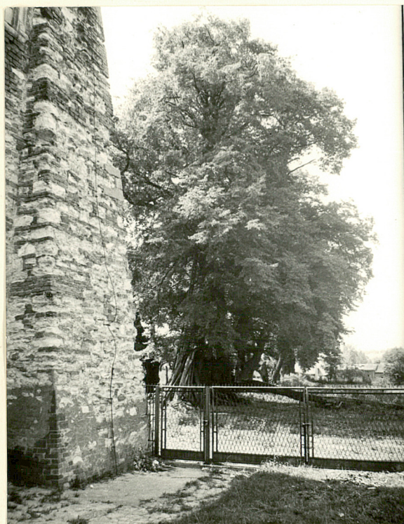
WIDOK NA SZPALER LIP W OGRODZIE

W 70-tych latach XX w. odrestaurowano kościół, rozebrano d. budynek gospodarczy w pn.-wsch. części zespołu, na miejscu którego w 1980 r. wzniesiono dom mieszkalny dla księży oraz zrekonstruowano narożną basztę kamienną włączoną w jego elewację wsch. W latach 1978-84 wykonano generalny remont budynku, w którym po ostatej wojnie mieści się Sąd oraz oficyna zajętej na siedzibę Prokuratury. Ok. 1990 r., w pd.-wsch. części ogrodu klasztorного wzniesiono nowy budynek katechezy (do dziś w stanie surowym). Aktualnie niewielka ilość pomieszczeń w czworoboku poklasztornym jest użytkowana głównie na lokale mieszkalne.