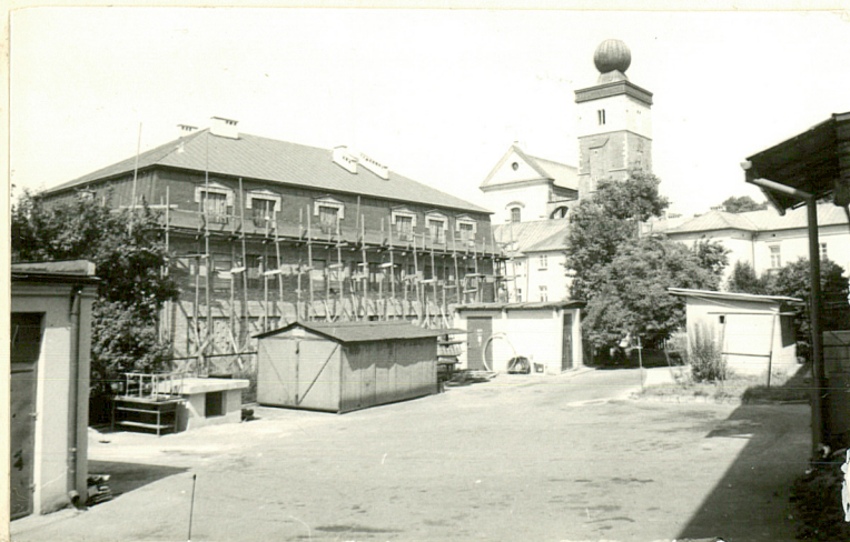
WIDOK OD STRONY PD.-ZACH. NA DOM KATECHEZY, BUD. SĄDU I KOŚCIOŁ Z WIEŻĄ