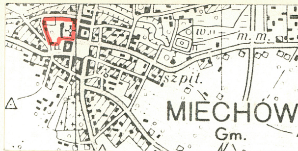
Plan orientacyjny zespołu, skala 1:25000, stan wg mapy z 1975 r.