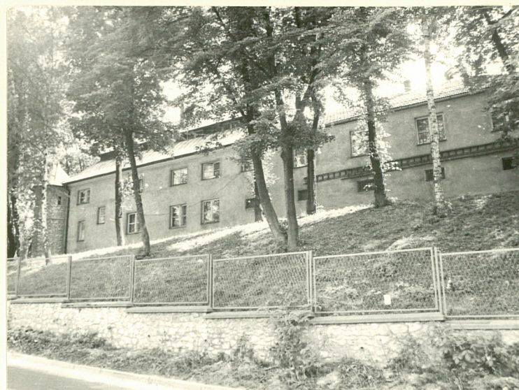
WIDOK OD PN. NA DOM DLA KSIĘŻY