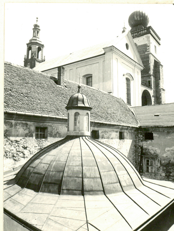
WIDOK Z WIRYDARZA KLASZTORU