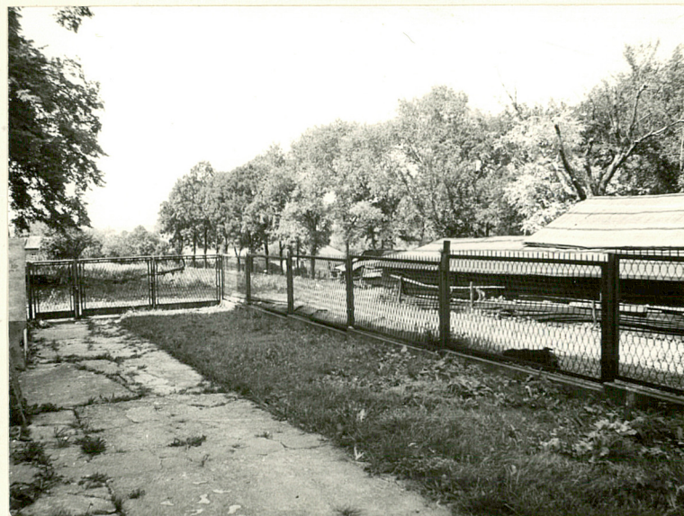
WIDOK NA DAWNY SAD PROBOSZCZAŃSKI