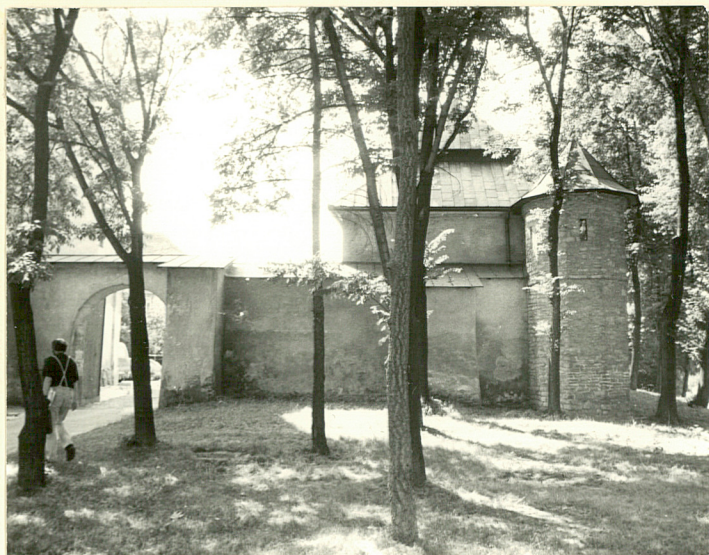
WIDOK OD WSCH. NA DOM DLA KSIĘŻY