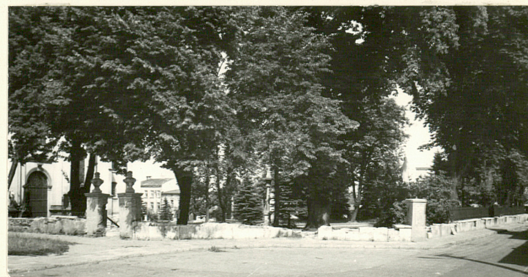
WIDOK OD PD.-ZACH. NA CMENTARZ PRZYKOŚC.

Załącznik opracował Olgierd Chojnacki - lipiec 1992.