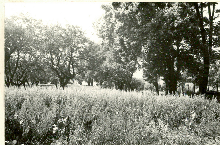
WIDOK NA DRZEWA OWOCOWE W OGRODZIE