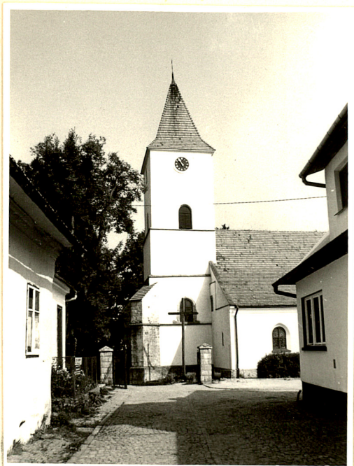
widok kościoła od południa z uliczki prowadzą- cej z rynku

2. Obiekt (nazwa jak w karcie) Kościół parafialny p.w. Sw. Andrzeja Ap. C.d. opisu + fot. dodatkowe.