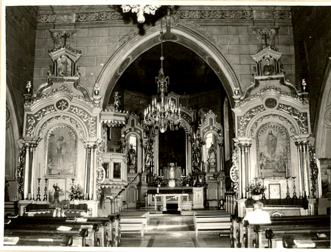
widok z nawy na prezbiterium