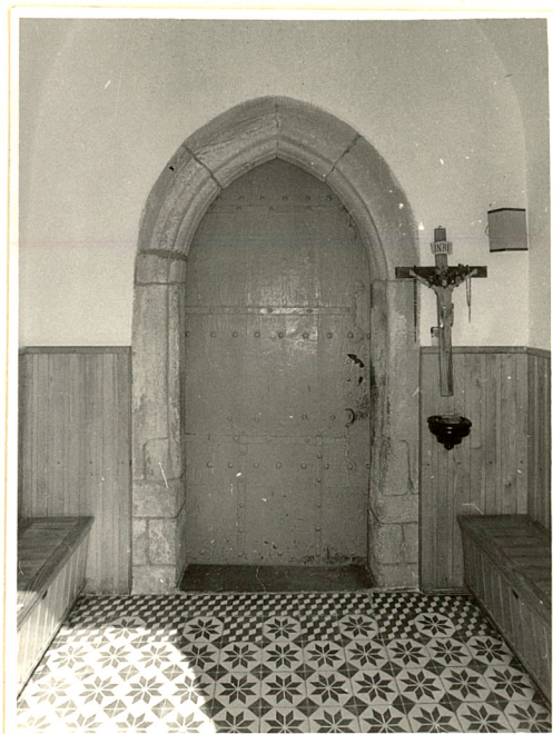
gotycki portal z XIV w. w przejściu z kruchty do nawy.

3. Zawartość wkładki ( nazwa obiektu lub materiału uzupełniającego ) Fot. dodatkowe.