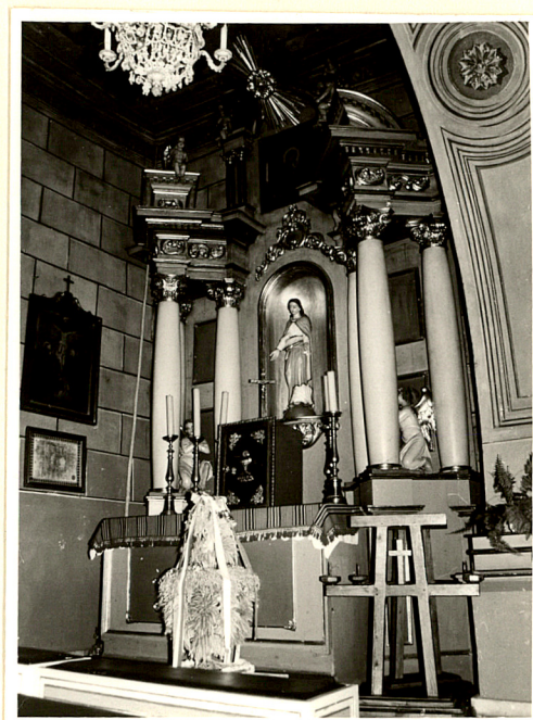
ołtarz w kaplicy po północnej stronie nawy