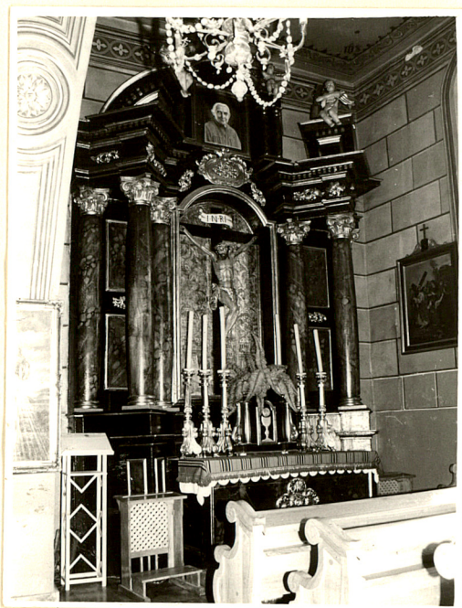
ołtarz w kaplicy południowej