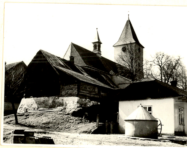
widok kościoła od płn-wsch.