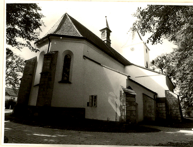
widok kościoła od płn-wsch.