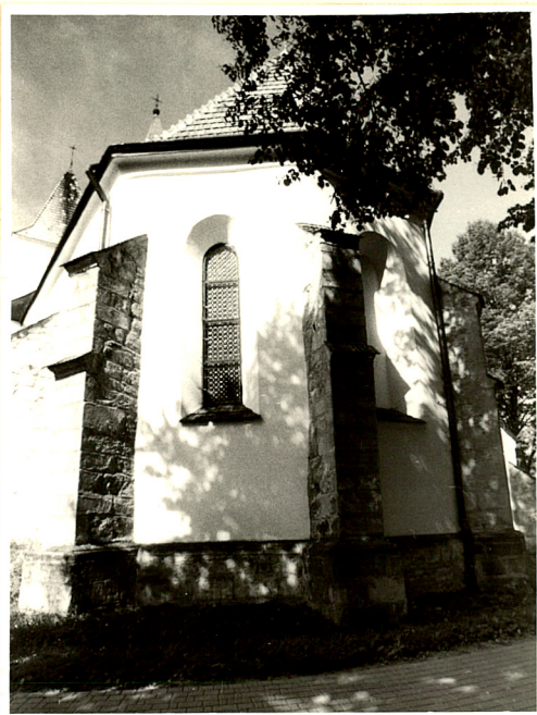
zamknięcie prezbiterium widok od wschodu

2. Obiekt (nazwa jak w karcie) Kościół paraf. p.w. Św. Andrzeja Ap. 3. Zawartość wkładki (nazwa obiektu lub materiału uzupełniającego) Fot. dodatkowe.