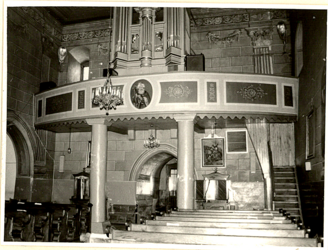
widok z nawy na chór muzyczny