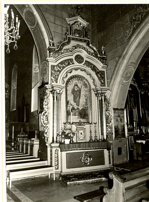
ołtarz boczny / prawy /