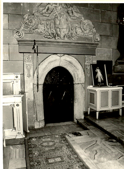
gotycki portal kamienny z XIV w. w przejściu z prezbiterium do zakrystii.