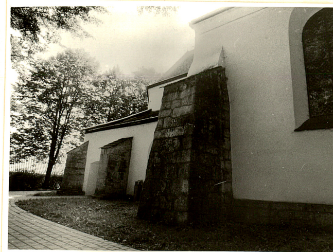
kamienne szkarpy prezbiterium i kaplicy od południa

Wkładkę założył: mgr M.H. Grabski IX 1997 r. (imię, nazwisko, data) PSOZ Tarnów