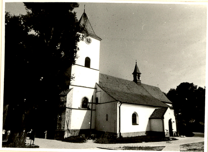
widok kościoła od południa