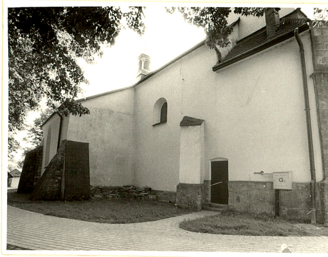
elewacja północna nawy