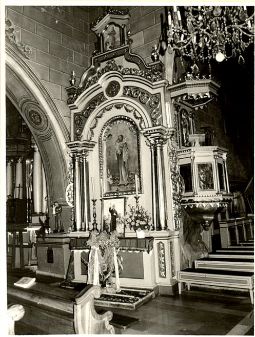
ołtarz boczny / lewy /

3. Zawartość wkładki (nazwa obiektu lub materiału uzupełniającego) Fot. dodatkowe.