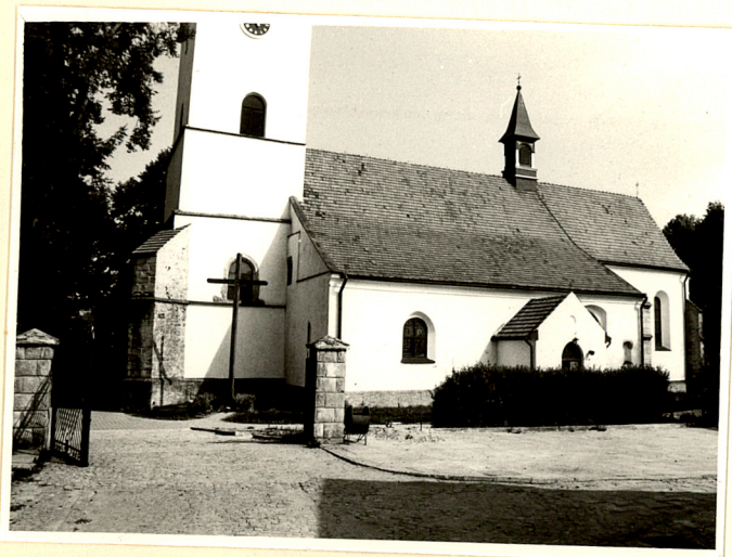
widok kościoła od południa