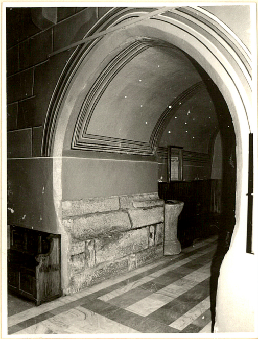
przejście z nawy do przedsionka wieży