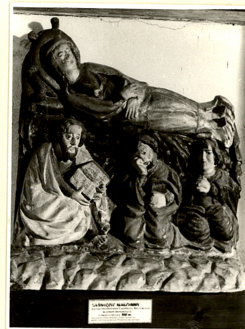
gotycka rzeźba Zaśnięcia NMP z XIV w.