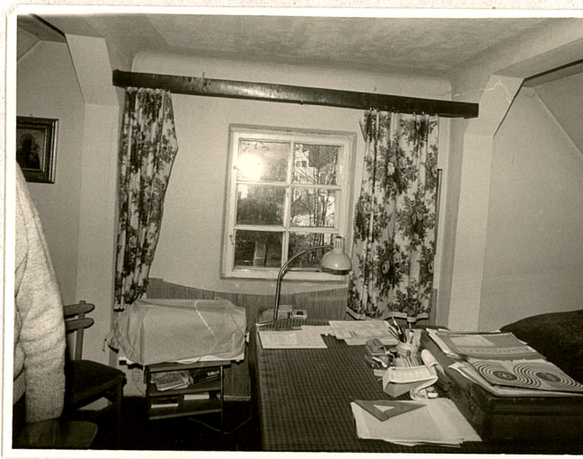
pomieszczenie mieszkalne poddasza