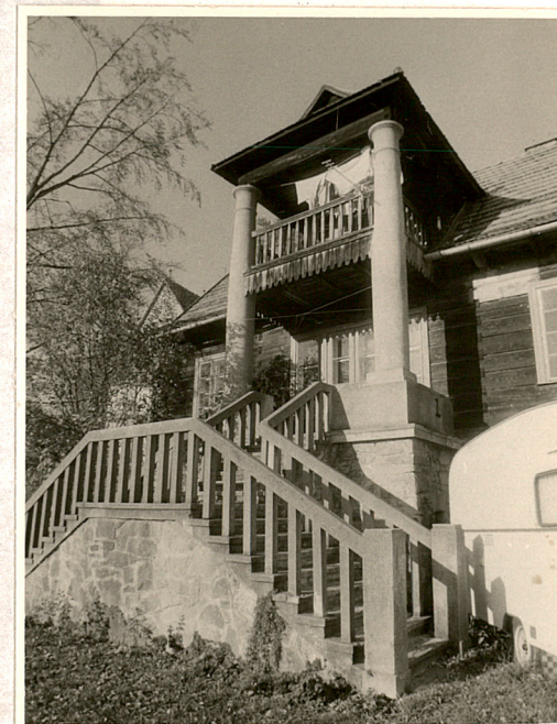
portyk kolumnowy elewacji frontowej