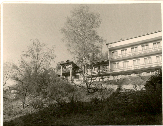
widok od południa