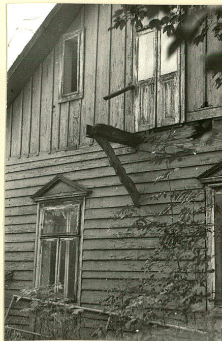
Fragment elewacji szczytowej płn-zach. ze śladami po oberwanym balkonie, stan wrzesień 1985r.