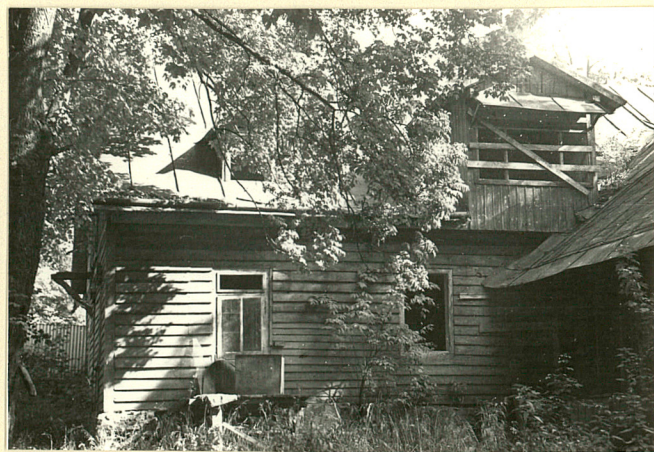
Elewacja tylna /płd-zach./, stan wrzesień 1985r.