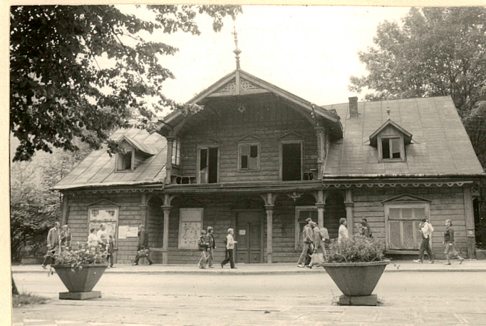
Widok od wsch pñ.-wschodu, stan 1983r.

Wkładkę założył: Zygmunt Lewczuk, listopad 1985r.