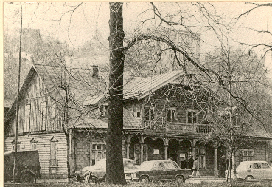
Widok od wschodu - stan 1973r.