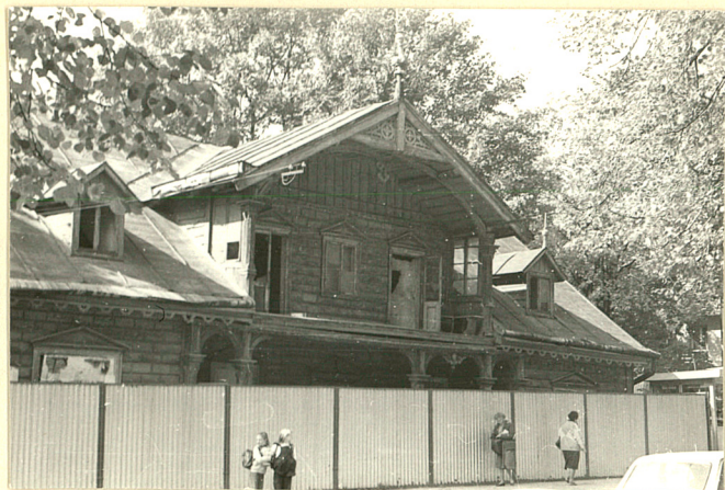
Widok od wschodu, stan wrzesień 1985r.