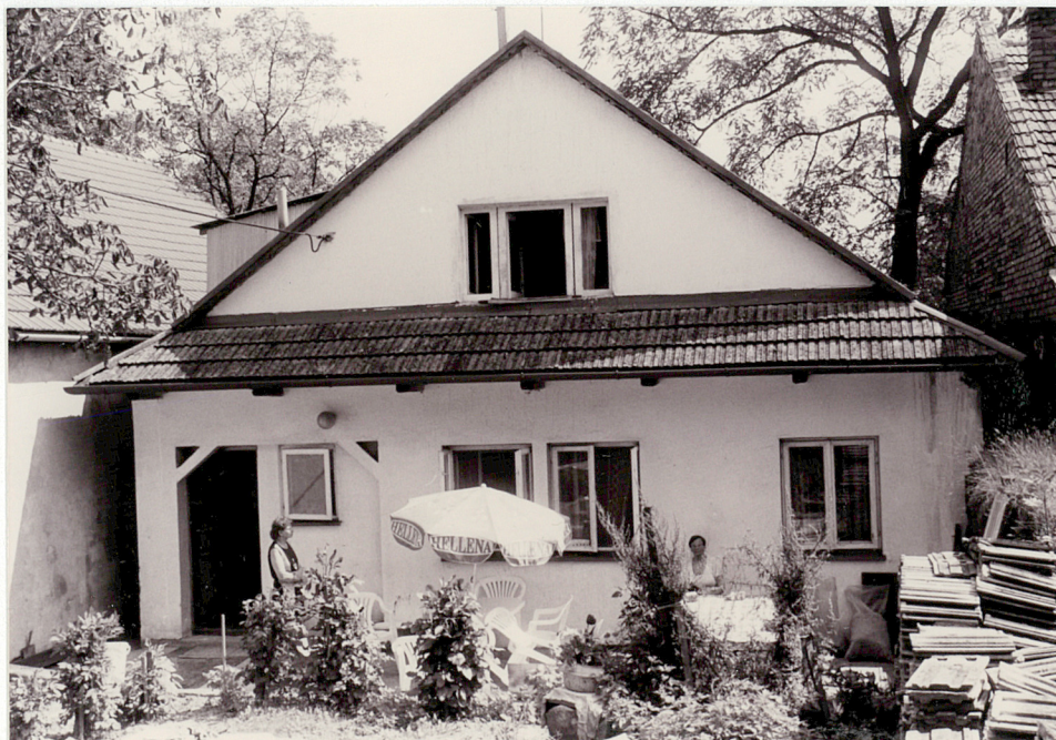
Elewacja tylna od północy