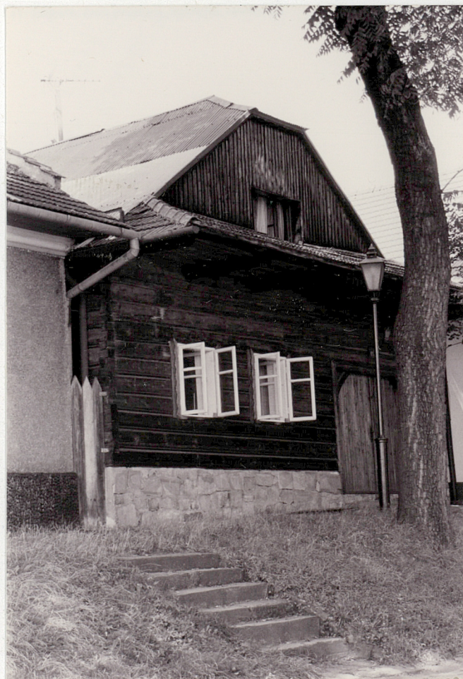
Widok od południowego-zachodu