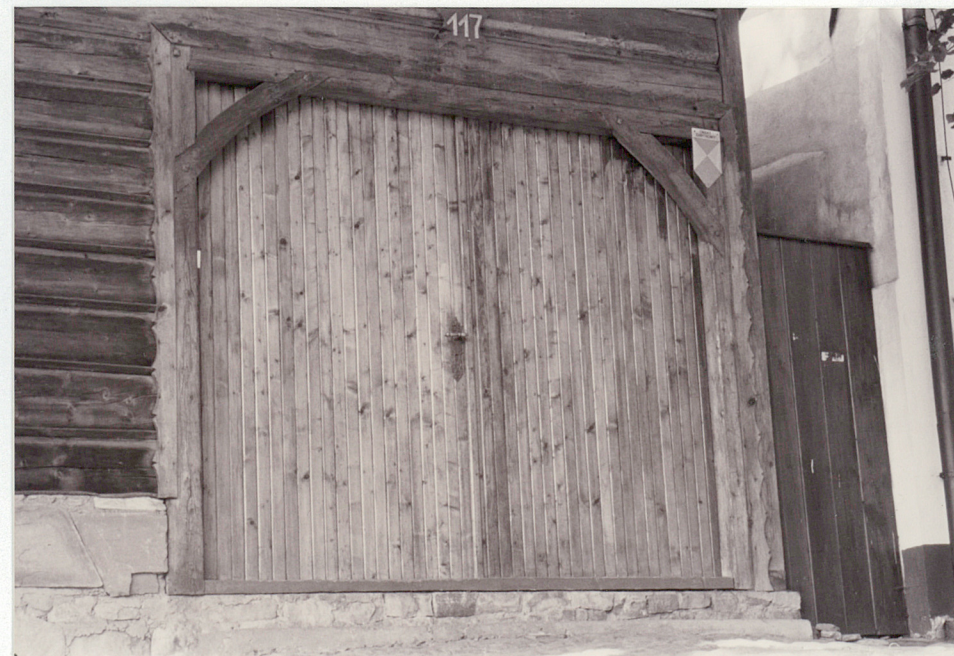
Wrota do sieni od frontu