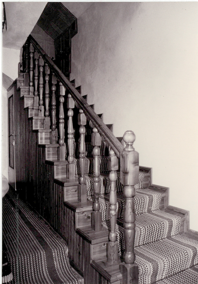
Schody na poddasze