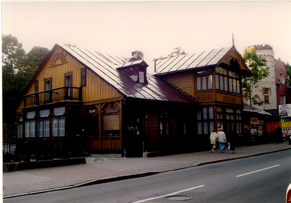
widok od płd-wsch. ganek