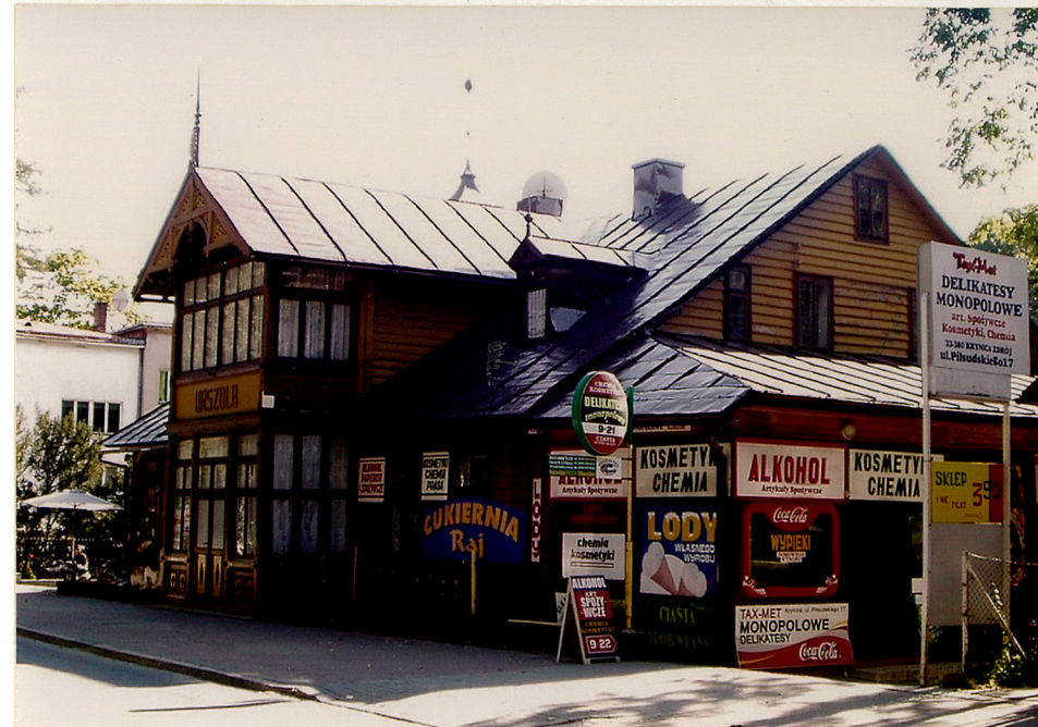
widok od płn-wsch. ganek