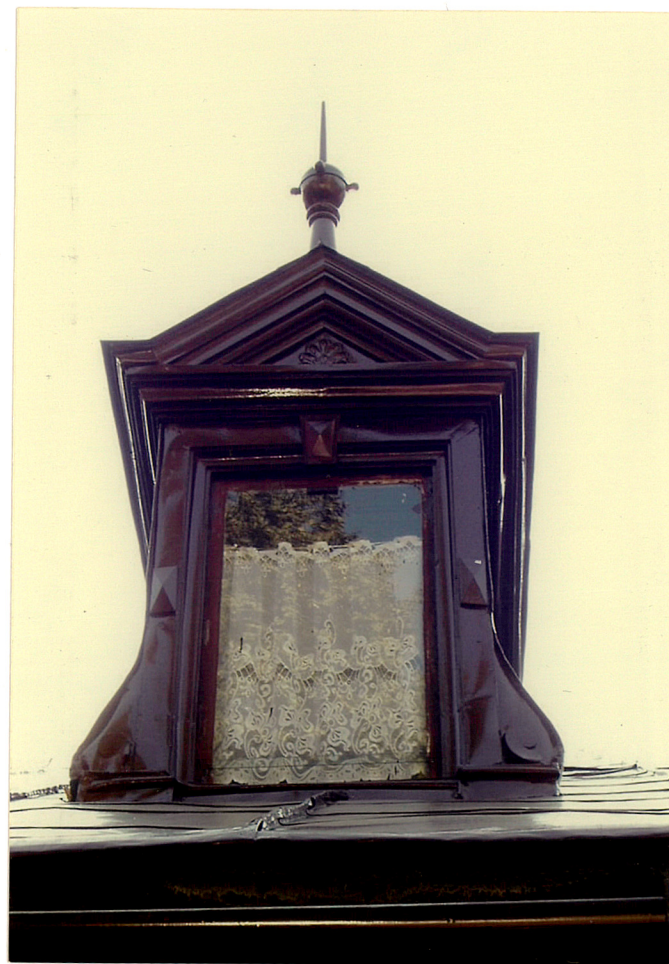
ozdobna wystawka we wschodniej połaci dachu