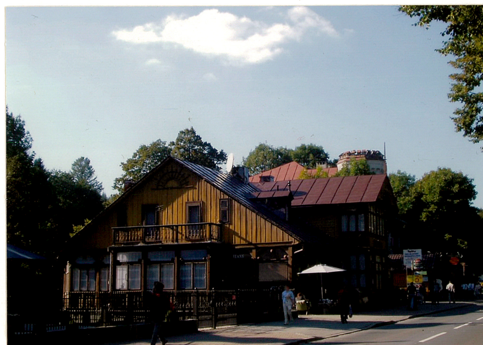
widok od płd-wsch.

Wkładkę założył: mgr M.H.Grabski IX 2005