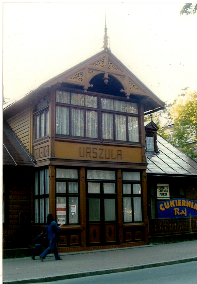
widok od wschodu

Budynek posiada instalację elektryczną, wodno-kanalizacyjną i gazową.