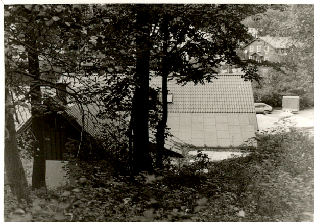
widok od wschodu