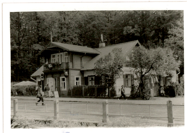
widok od pld-zach.

Budynek posiada instalację elektryczną, wodno-kanalizacyjną i gazową. Kominy murowane z cegły, w ścianach działowych, tynkowane. Schody na poddasze kręcone w obudowie drewnianej.