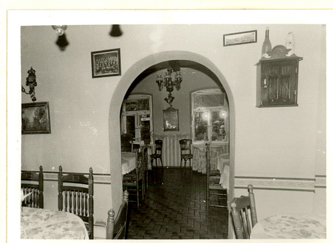
pomieszczenie parteru / restauracja /