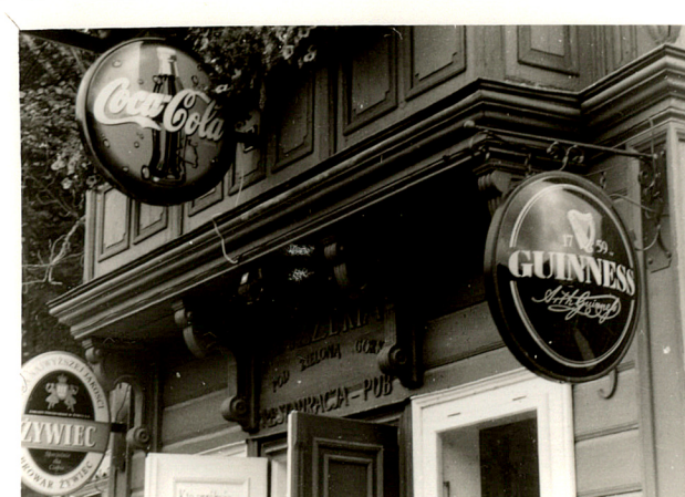
detal konstrukcyjny balkonu