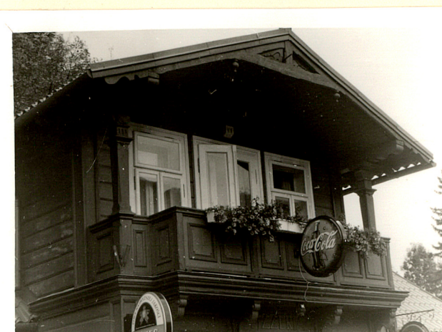
ganek z balkonem