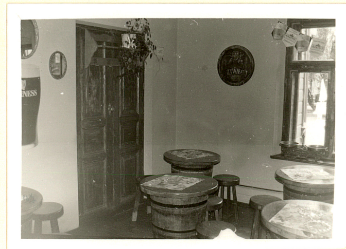
pomieszczenie parteru / pub /