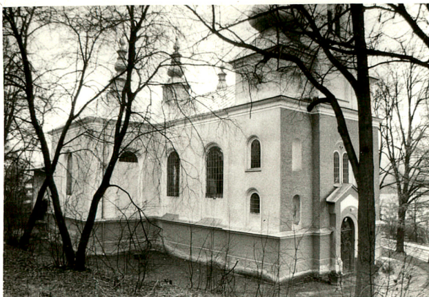
widok od płd-zach.

Ponadto na ścianach obrazy : Chrzest Chrystusa Św. Piotr i Św. Paweł