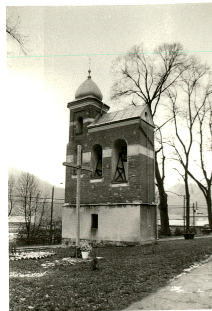
widok od północy