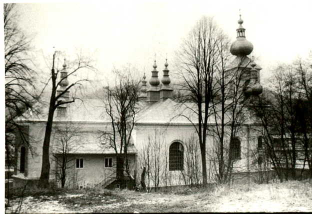
widok od południa

Przy kościele znajduje się dzwonnica wolnostojąca . Dzwonnica z czasu powstania świątyni, o architekturze i opracowaniu elewacji powiązanej z kościołem / cerkwią /. Dzwonnica w formie potrójnej arkady o zróżnicowanych prześwitach, z małą kopułą nad częścią wschodnią. W przyziemiu trzy lokalności. Dzwonnica murowana z cegły i kamienia, częściowo tynkowana. Nakryta daszkiem dwuspadowym, pobitym blachą. Dzwony odlane w latach 1955-65.