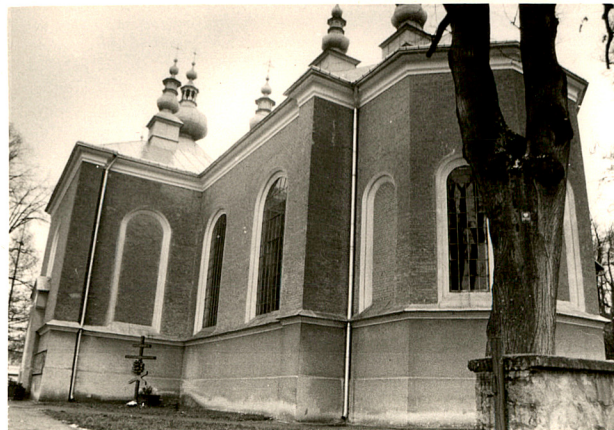
widok od płn-wsch.