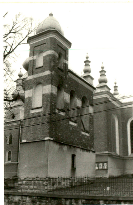
widok od wschodu