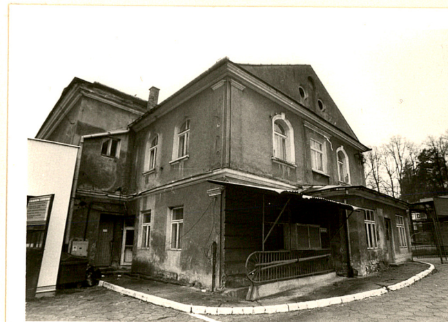
plebania przy ul. Kraszewskiego / widok od zachodu, płd-zach. i północy /

Wkładkę założył: mgr Marek H. Grabski XI 1998 r. (imię, nazwisko, data)