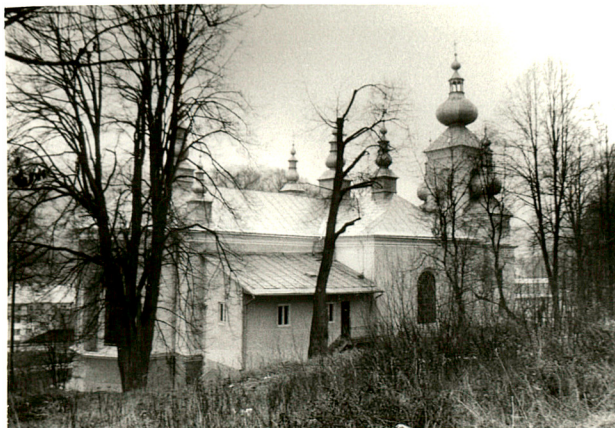
widok od płd-zach.