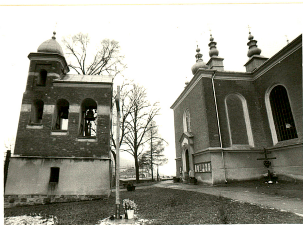
widok od płn-zach.