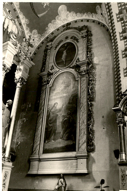
obraz Chrystusa dającego klucze św. Piotrowi