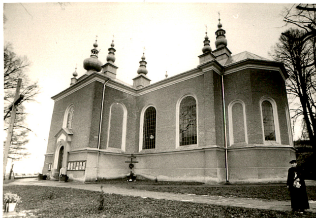
widok od płn-wsch.