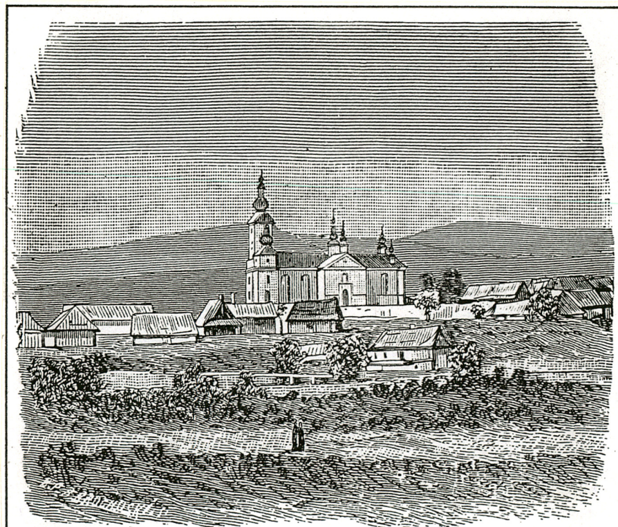
CERKIEW W KRYNICY.