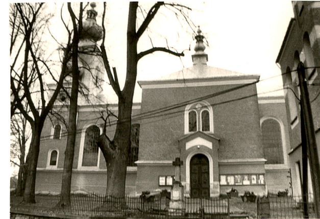
widok od wschodu