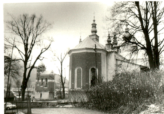
widok od północy