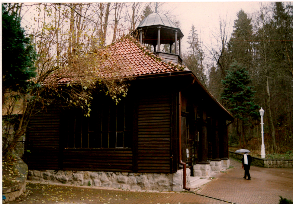
widok od zachodu