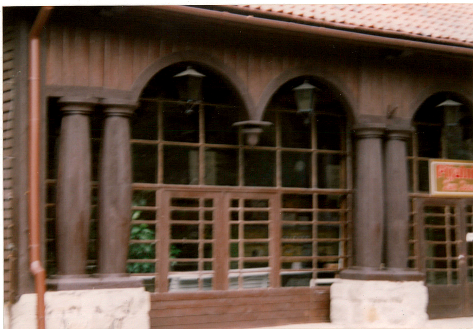
wejście do budynku