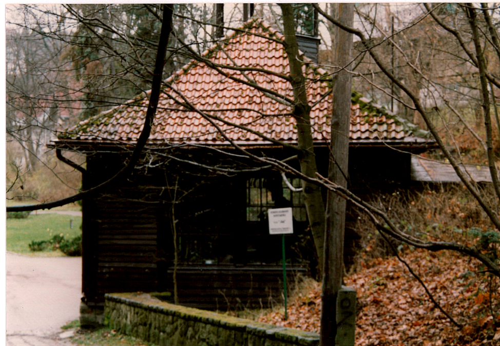
widok od wschodu