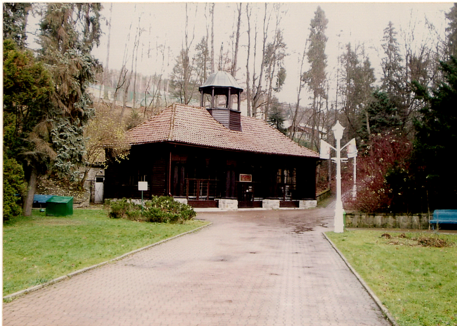
widok od południa