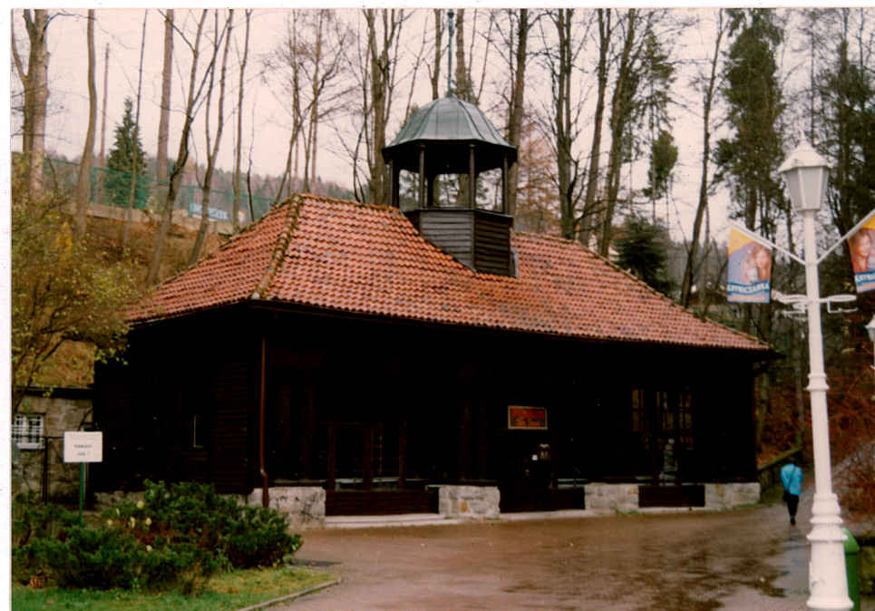
widok od południa

Pawilony nad zdrojami "Jan" i "Józef" rekonstruowane były w latach 1916-1918, a w 1923 roku podjęto decyzję o budowie dla nich wspólnego budynku, dającego możliwość korzystania z wód w zamkniętym pomieszczeniu w sezonie zimowym. Wzniesiono wówczas drewniany, jedno-kondygnacyjny pawilon na planie prostokąta, z charakterystycznym frontowym podcieniem o dwułuczach wspartych na parzystych, drewnianych kolumnach. W czterospadowym dachu umieszczono ażurową latarnię z kopulastym zwieńczeniem doświetlającym wnętrze. Przy budynku od strony północnej (w skarpie) powstał wówczas murowany budynek zaplecza, do którego doprowadzono wodę z oddalonego ok. 200 m źródła "Józef", mającego swoje źródło w pobliżu DW "Farys". Pawilon odnawiany był gruntownie w latach 1980-tych i po 2000 roku. Prace objęły wymianę substancji drewnianej (szalunki, stolarka), a także wzmocnienie podmurówki.