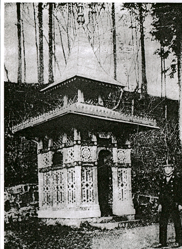
26. Zdrój „Jana”. Fot. przed 1907, wg „Ilustr. Przewodnik po Krynicy”