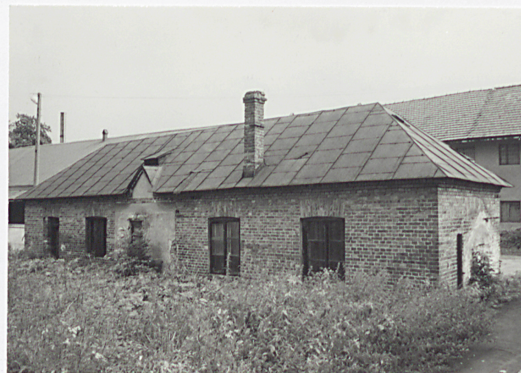
Dom ogrodnika tzw. "Gaśiorówka"