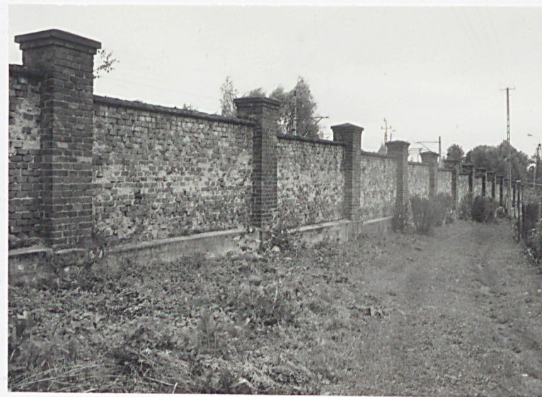
Fragment muru na zachodniej granicy zespołu