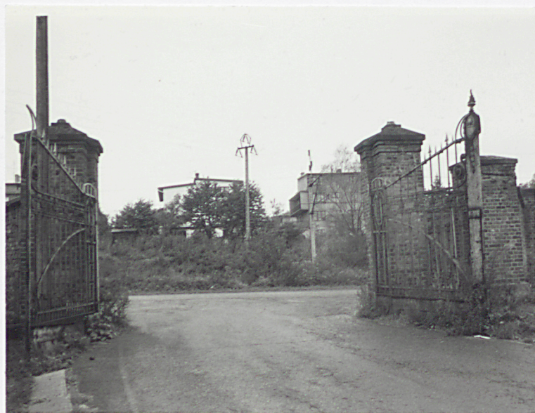
Główna brama wjazdowa na teren zespołu