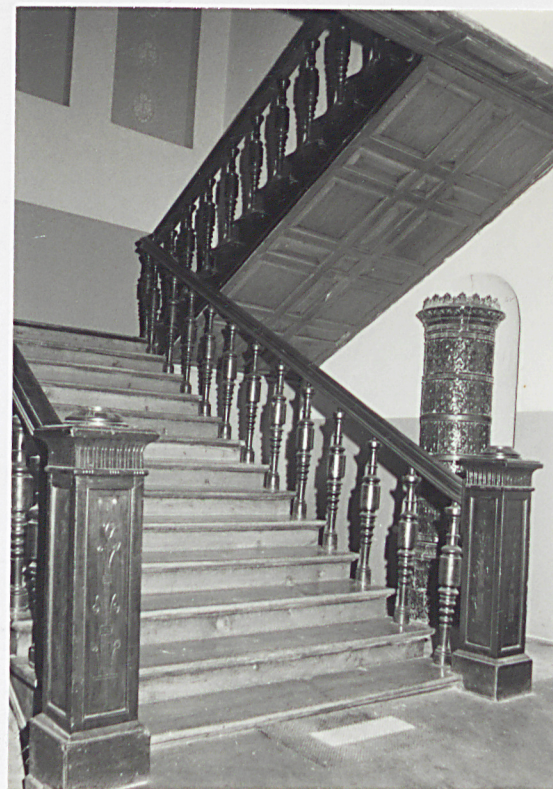
Klatka schodowa we dworze

3. Dawna gorzelnia. (ob. rozlewnia wina, pomieszczenia socjalne, magazyn, nr na planie syt. 4). Zbudowana około 1880 r. Przebudowana 1950 - 56. Murowana, potynkowana. Na planie wydłużonego prostokąta, w części północnej dwukondygnacyjna z jednoosiową nadbudówką, w części południowej, jednokondygnacyjna.