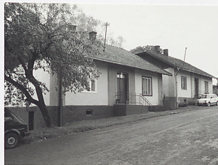
Domy mieszkalne 1919 r. ( od północnego-wschodu )