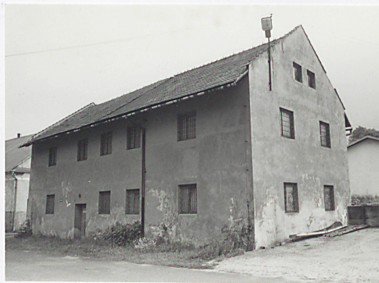
d. Młyn od południowego-zachodu