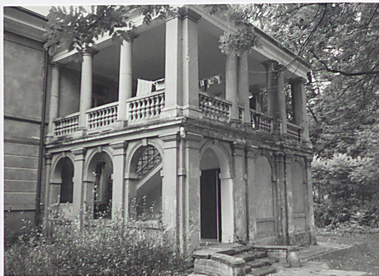
Loggia we dworze