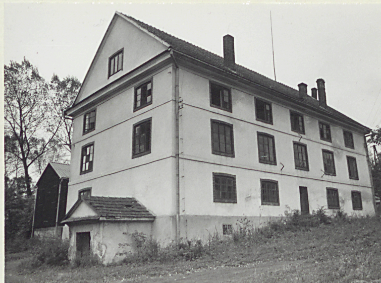
d. Spichlerz od północnego-wschodu