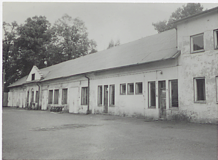
d. Stajnia od południowego-zachodu