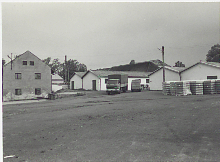
d. folwark od południowego-zachodu