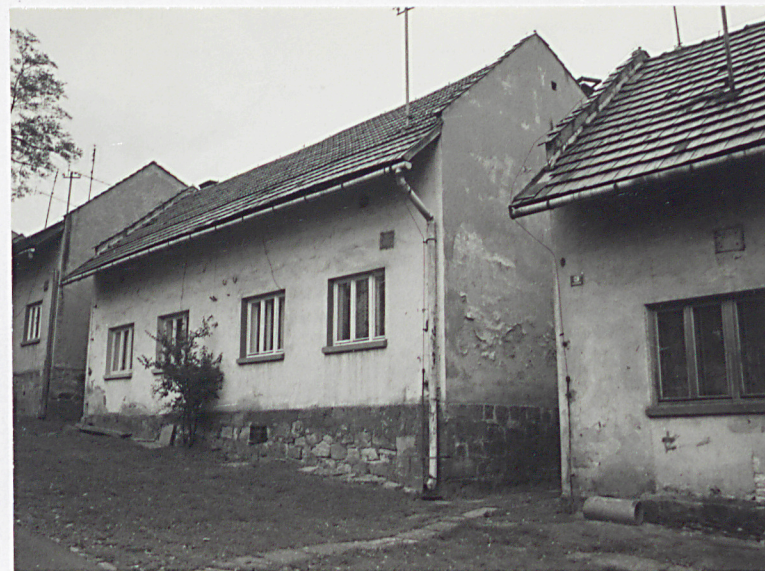
Domy mieszkalne 1922 r. ( od płd.-wsch. )