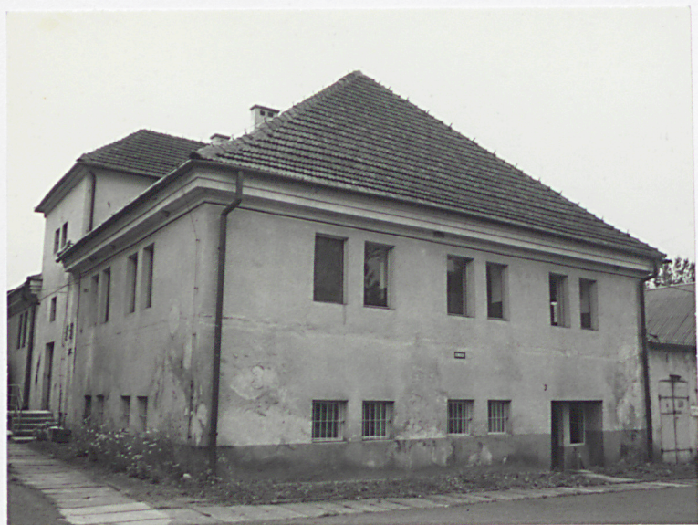
d. Gorzelnia od północnego-wschodu