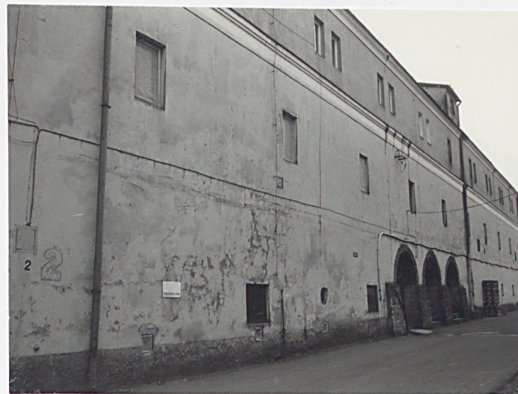
d. browar od północnego-zachodu

11. Mur . Zbudowany na początku XX w. Zachowany fragmentarycznie. Murowany z cegieł, nie potynkowany. Złożony z niższych ścianek wbudowanych pomiędzy czworokątne, wyższe filary.