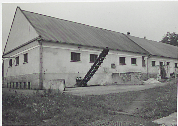
D. Magazyn zboża od południowego-wschodu