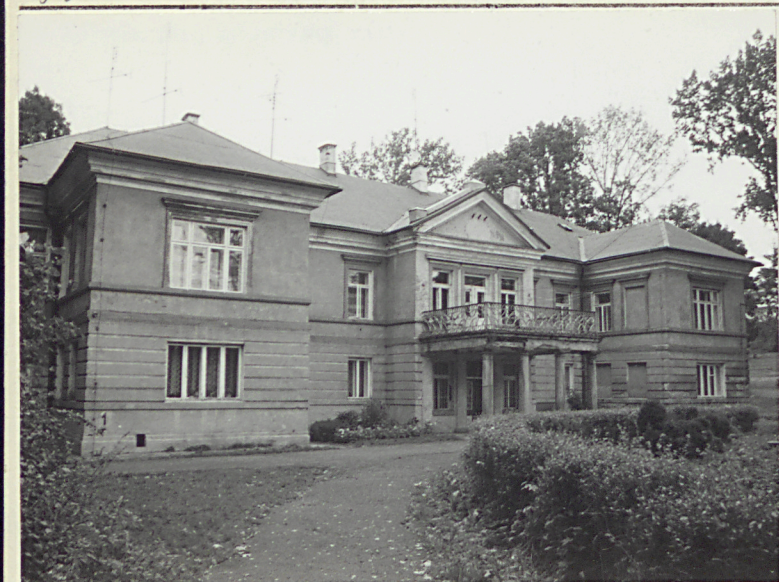
Dwór od południowego-zachodu