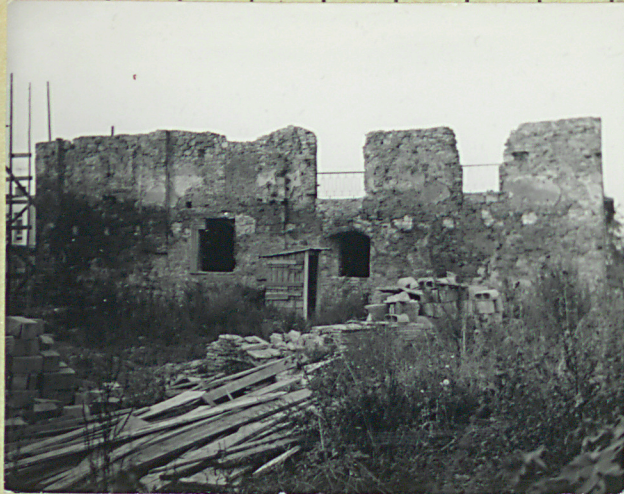
Uwagi opisowe, fotografia

Usytuowany w pn.-wsch. części miasta, na trójkątnym tarasie opadającym stromą szkarpą do doliny Ropy. Murowany, z kamienia i cegły. Prostokątny. Ściany częściowo zachowane do wysokości trzech kondygnacji. Po stronie wsch. zachowane ściany piwnicy, częściowo parteru i piętra. Na parterze dwa otwory okienne. W części środkowej partii piwnicy dwa otwory strzelnicze. W elewacji pn. ściana zachowana tylko na parterze. W niej otwór wejściowy z kamiennymi węgarami, bez nadproża, oraz niewielki otwór okna. Elewacja zachodnia zachowana w formie fragmentu o wysokości parteru, ze śladami pilastrowań. Elewacja pd. zachowana w wysokości piętra. Czterosiowa. W części zachodniej trzy pilastry między nimi na parterze otwór w obramieniu renesansowym. Pozostałe otwory zamurowane, z widocznymi fragmentami renesansowych obramień. Na parterze zamurowana strzelnica. Piwnice o układzie nieregularnym. Parter trzytraktowy. Piwnica jedna sklepiona, w jednej pozostałości stropu belkowego. Pomieszczenia parteru były sklepione kolebkowo. W wielkiej sali kamień z datą 1410/zap. z okazji 500 lecia bitwy pod Grunwaldem położony/. Pomieszczenia piętra również były sklepione kolebkowo.