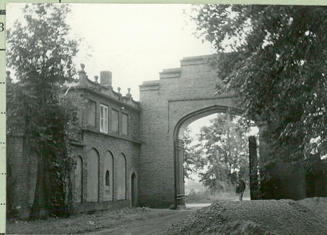
35. Uwagi różne