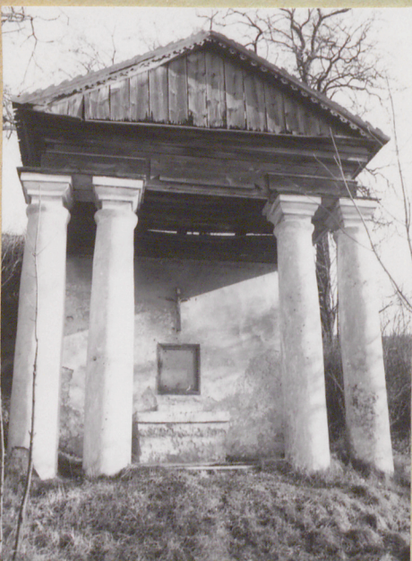
Fot. 1368 (2)