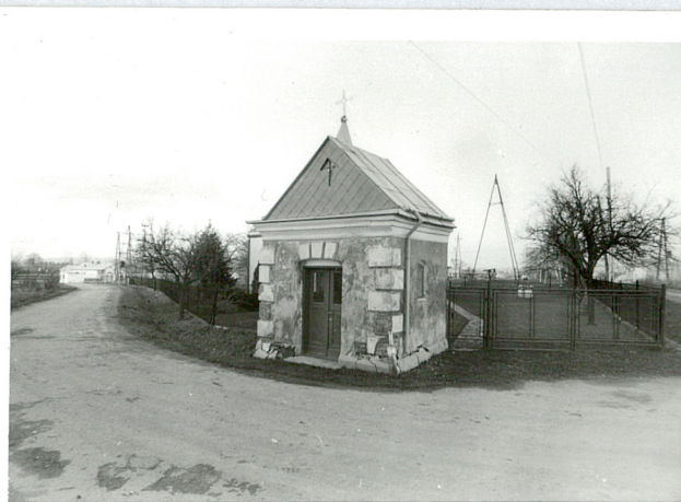
widok od płd-zach.