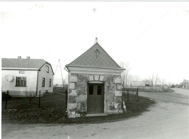
widok od zachodu