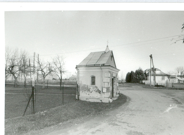
widok od północy