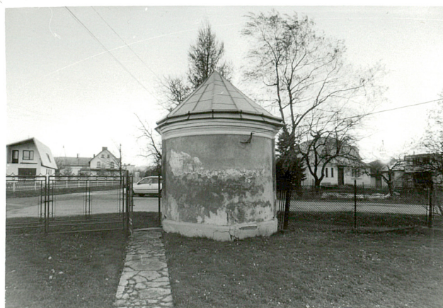
widok od wschodu