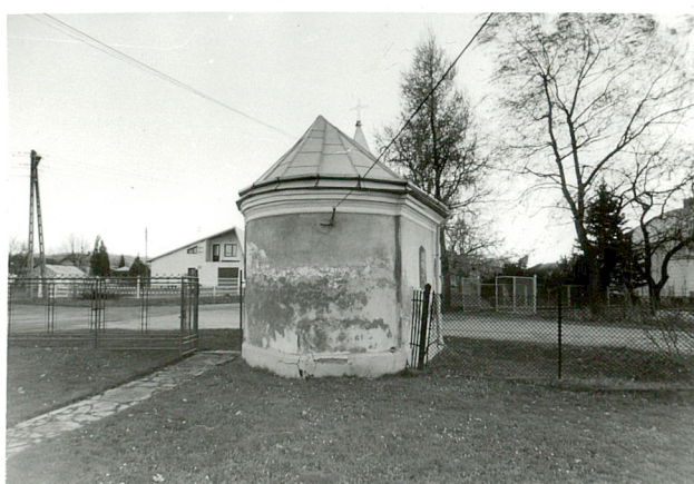
widok od półn-wsch.