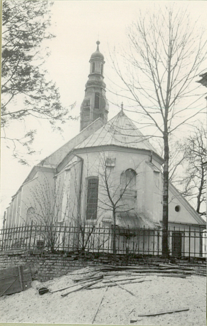
FOT. 1967 (3)