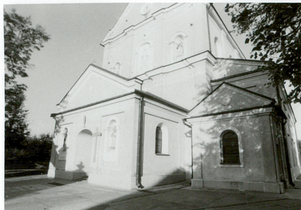
przedsionek - kruchta