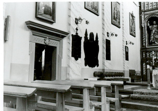
portal w prezbiterium