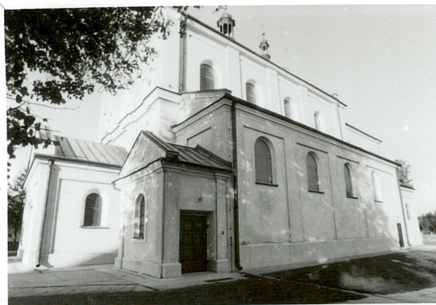
widok od półd-zach.