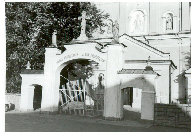
neobarokowa brama w ogrodzeniu