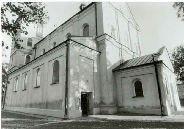
widok od półn-zach.