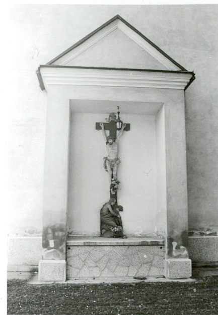
kaplica w zamknięciu prezbiterium