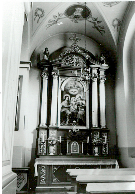
ołtarz w nawie bocznej /prawej/