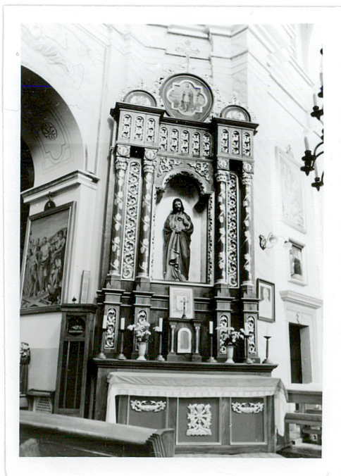
ołtarz boczny przy tęczy / lewy /