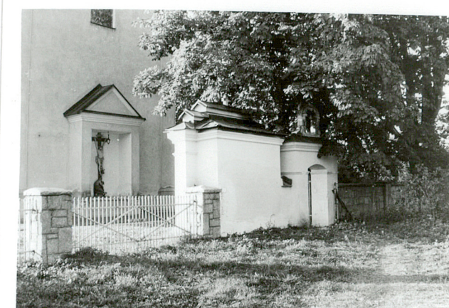
kapliczki w ogrodzeniu kościoła