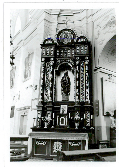
ołtarz boczny przy tęczy / prawy /