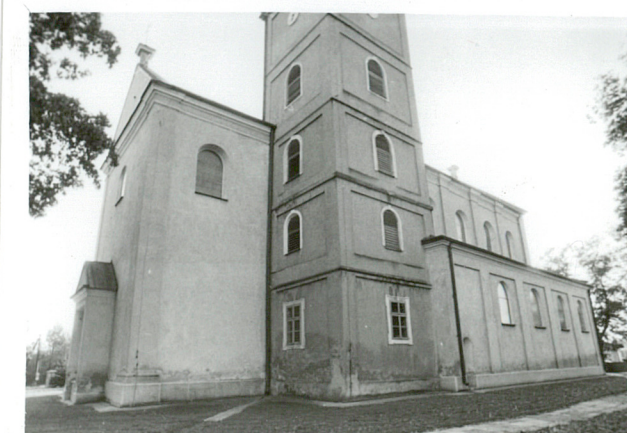
widok od płn-wsch.