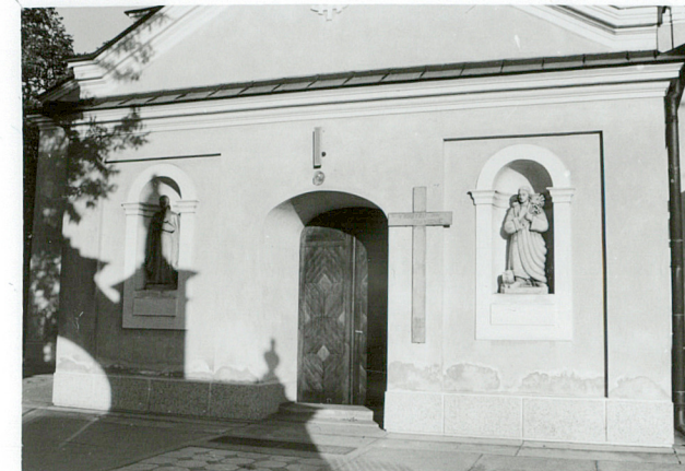
wejście do kruchty