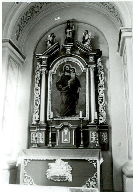
ołtarz w nawie bocznej/lewej/