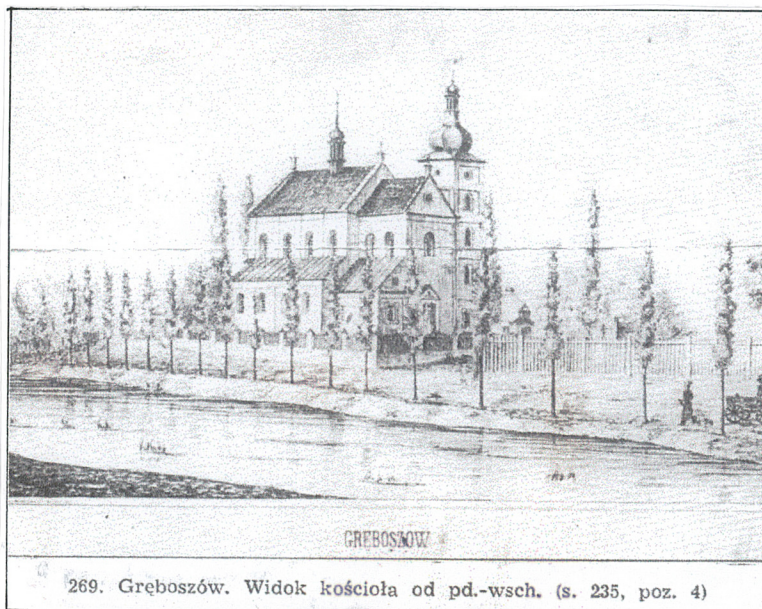
269. Gręboszów. Widok kościoła od pd.-wsch. (s. 235, poz. 4)