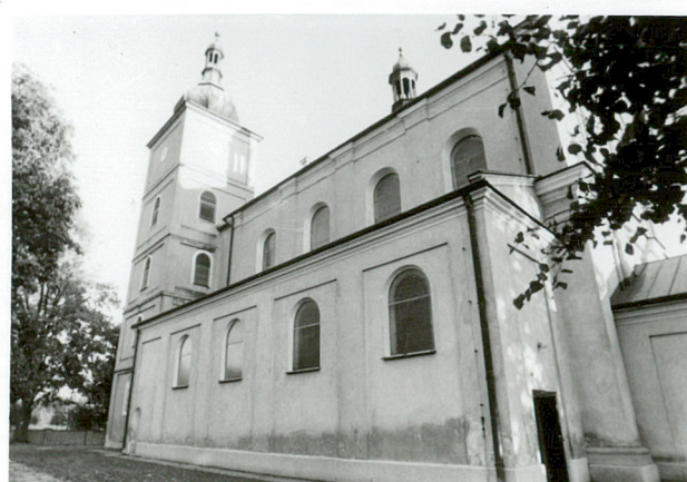
widok od płn-zach.