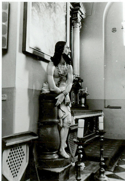
Chrystus u słupa