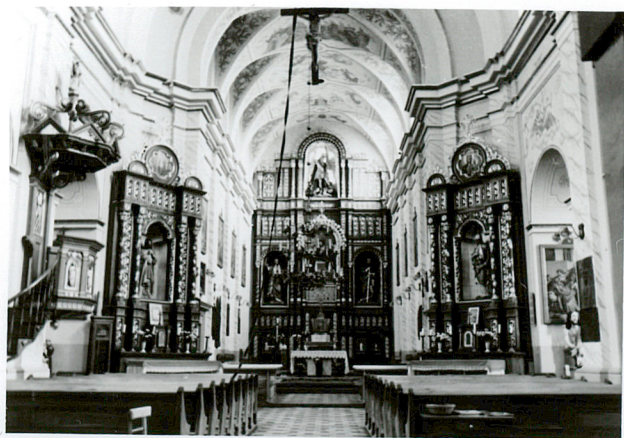
widok na prezbiterium