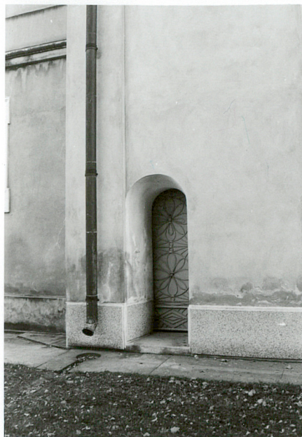
wejście do wieży