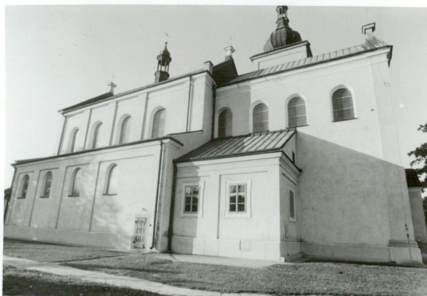
widok od płd-wsch.