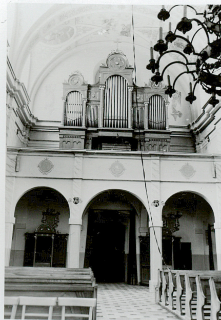
widok na chór muzyczny