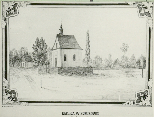
KAPLICA W BORUSOWIEJ