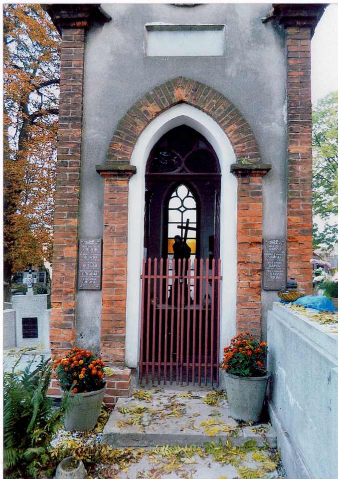
wejście do kaplicy