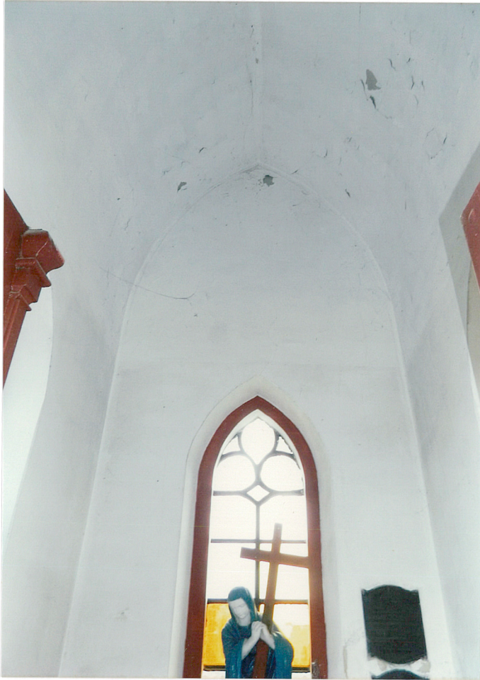
sklepienie kolebkowe kaplicy