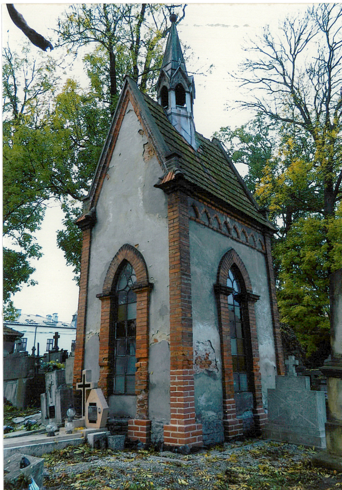
widok od zachodu