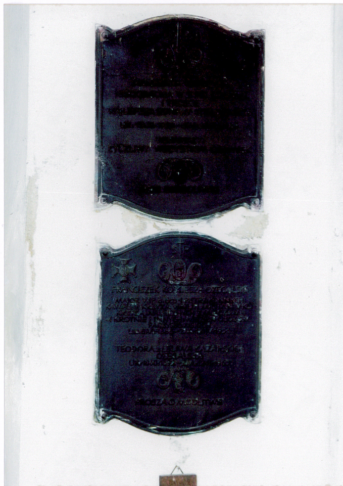
tablice epitafijne we wnętrzu