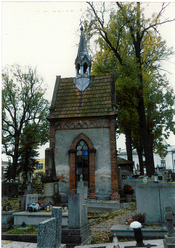
widok od północy