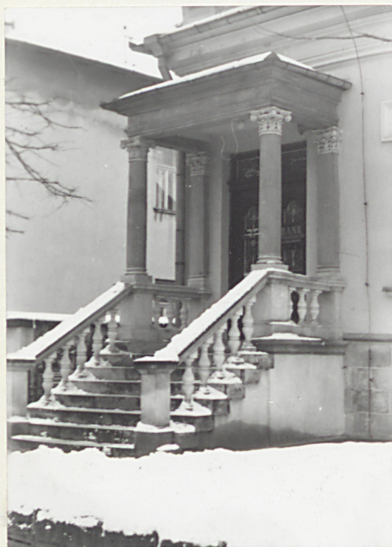
3. WEJŚCIE PD. W ELEW. FRONTOWEJ