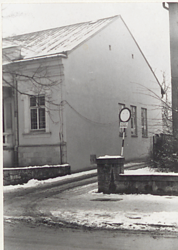
7. ELEWACJA PN.