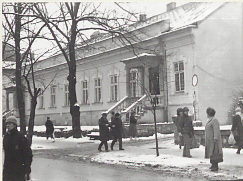
2. WIDOK OD PN.