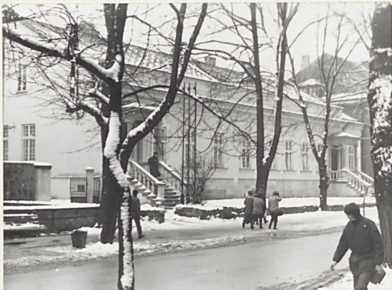
1. WIDOK OD PD.

11. Zdjęcia, rzut, przekrój, sytuacja, orientacja