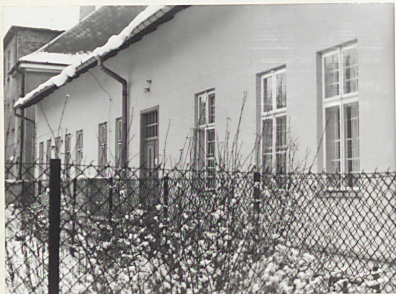
6. ELEWACJA ZACHODNIA