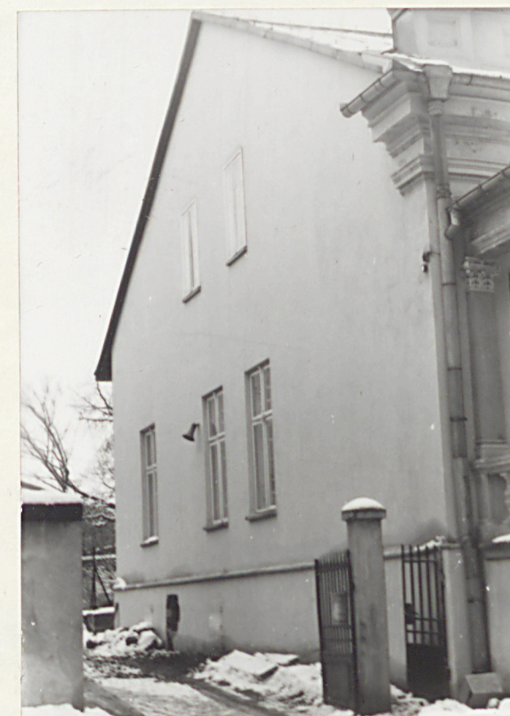
5. ELEWACJA PD.

Wkładkę założył: Łukasz Konarzewski , XII 1990 r. (imię, nazwisko, data)