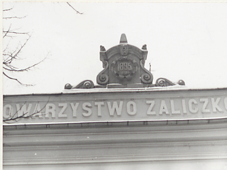
4. FRAGMENT ZWIĘCZENIA EL. FRONTOWEJ.