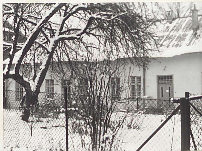
8. FRAG. PN. ELEWACJI ZACH.