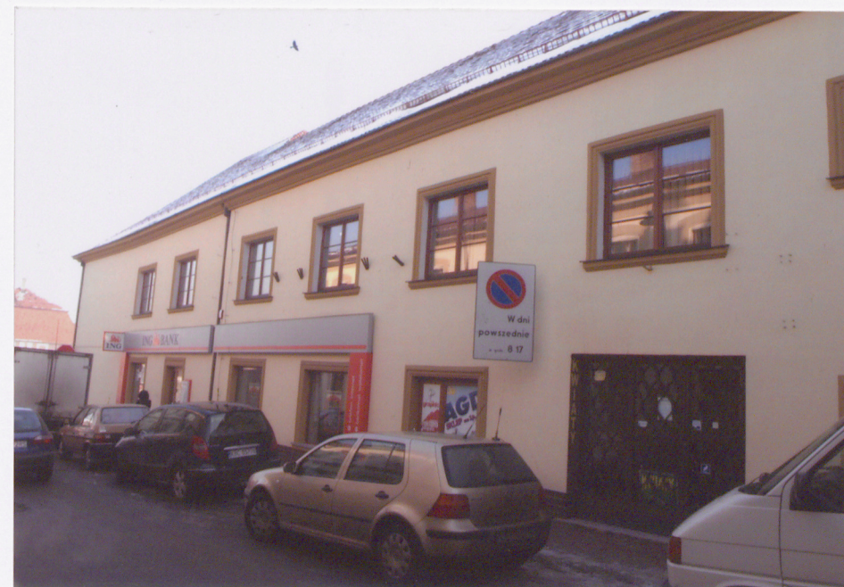
skrzydło północne budynku