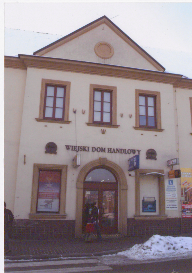
ryzalit w fasadzie