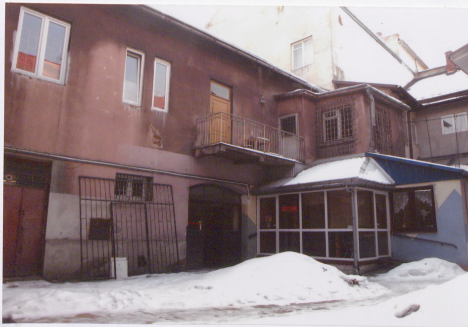
elewacje budynku od strony dziedzińca