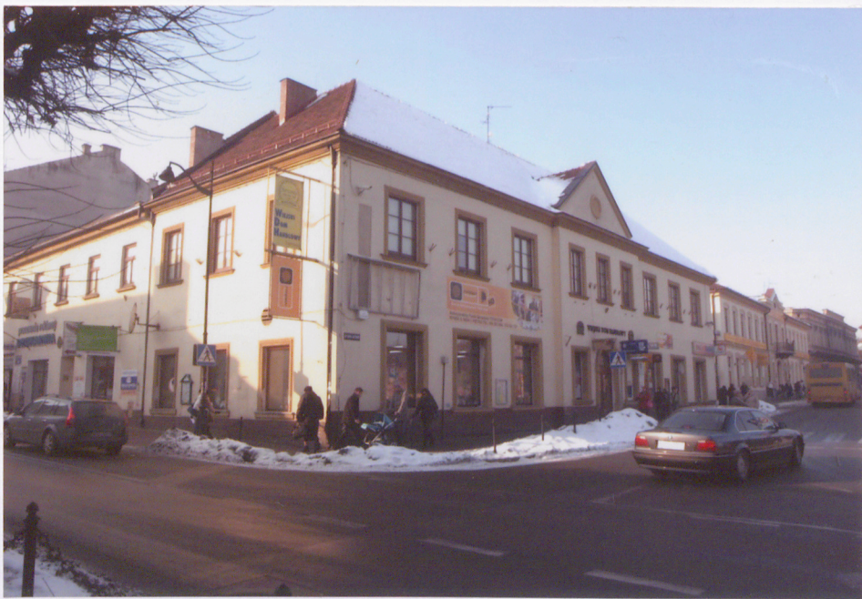
widok od południowego-wschodu