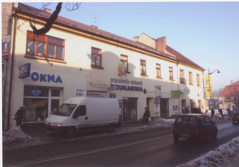
Skrzydło południowe budynku