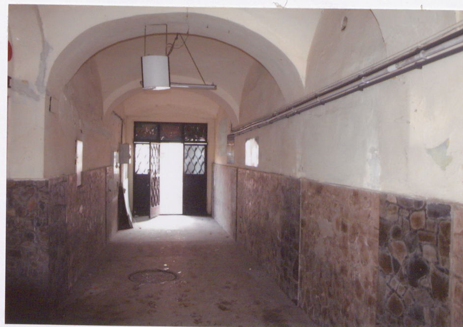
brama przejazdowa w skrzydle południowy budynku