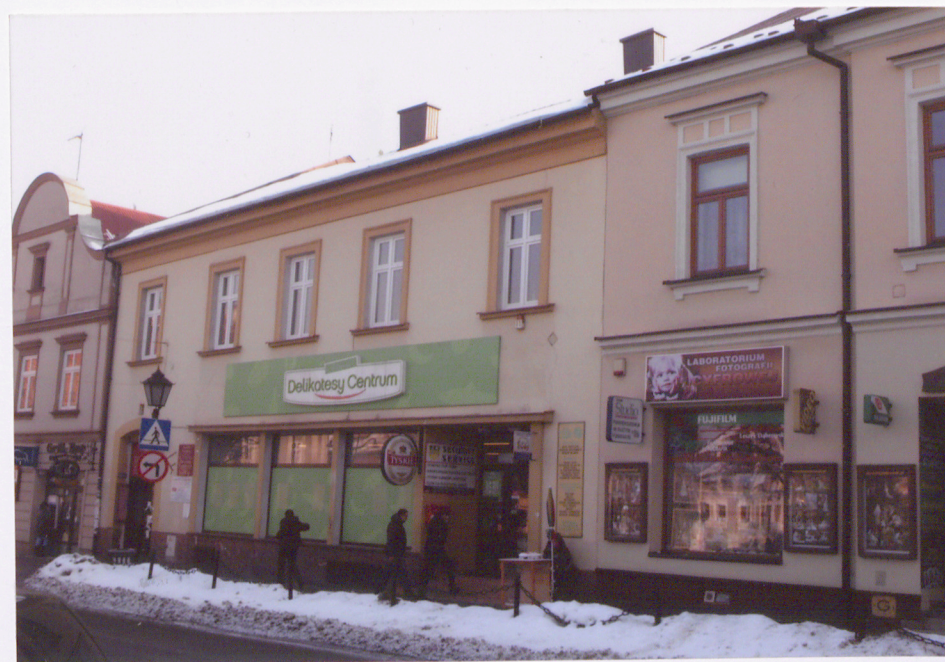
widok od północno-zachodu