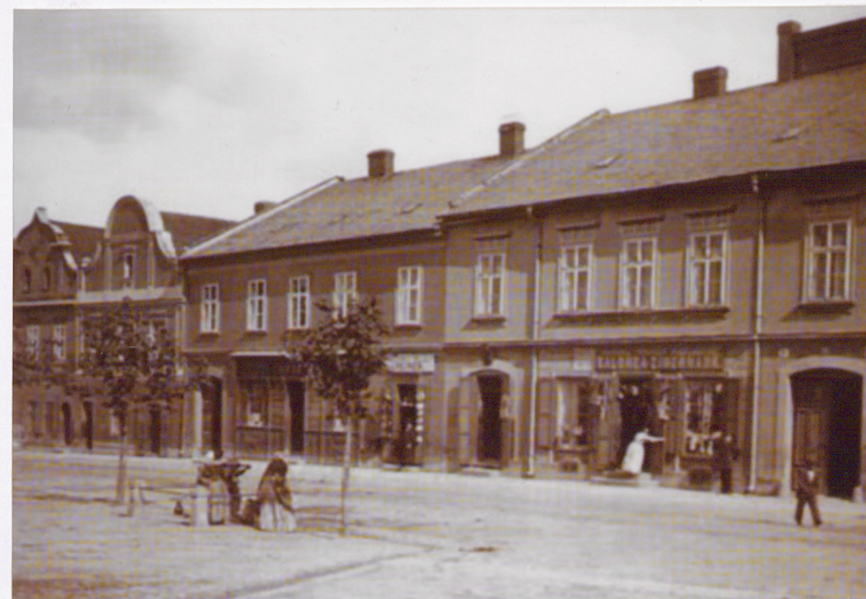
fotografia archiwalna z lat 1920-tych