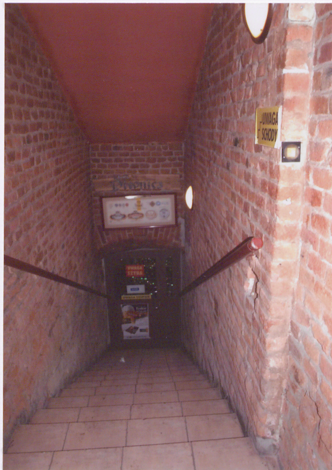
zejście do piwnic budynku