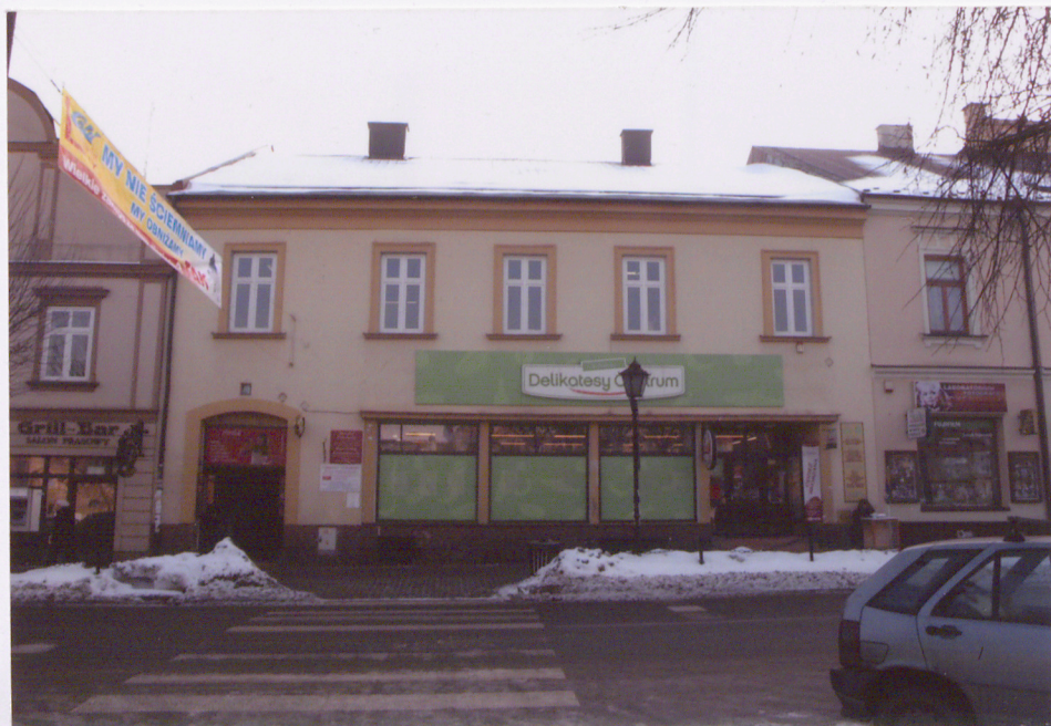
widok od północy