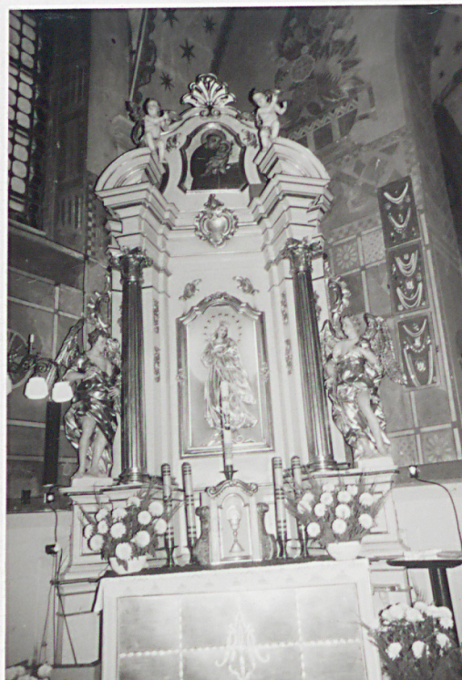
Ołtarz boczny – pn.