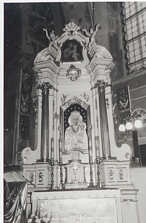
Ołtarz boczny – pd.