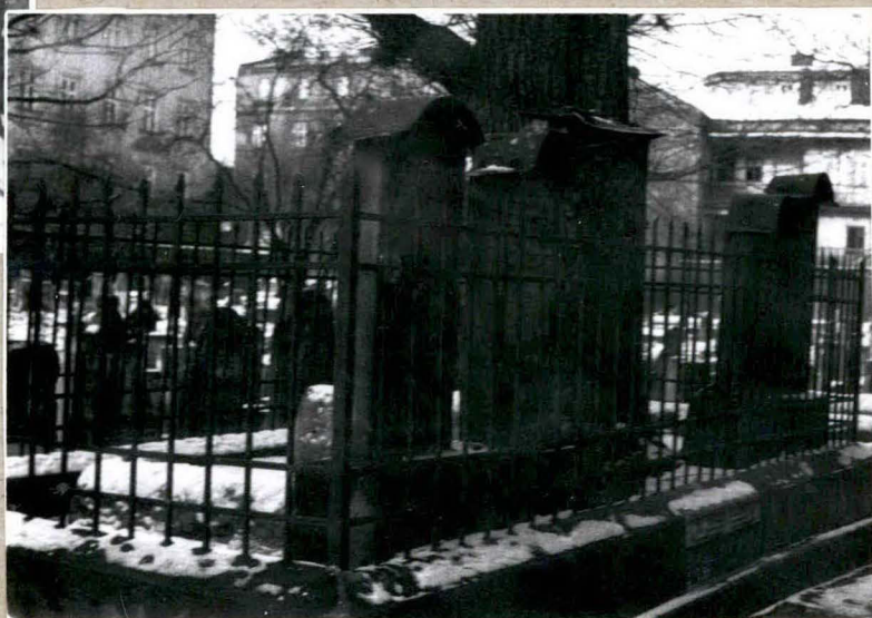
NAGROBEK RAB ISSELESA