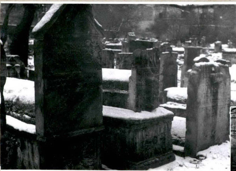
WIELKI NAGROBEK W POBLIU SYNAGOGI