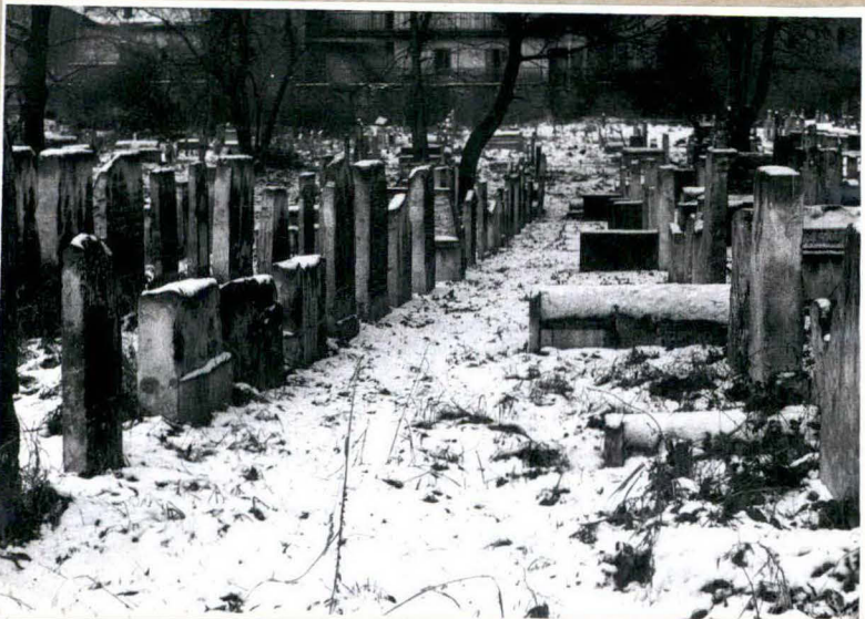
PÓŁDNIOWA CZĘŚĆ CMENTARZA