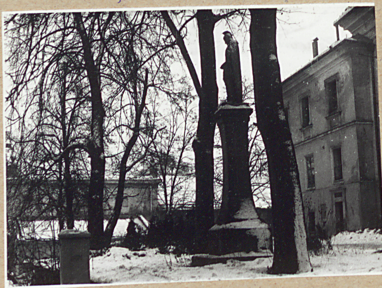
WIDOK NA PĘD CZĘŚĆ CMENTARZA