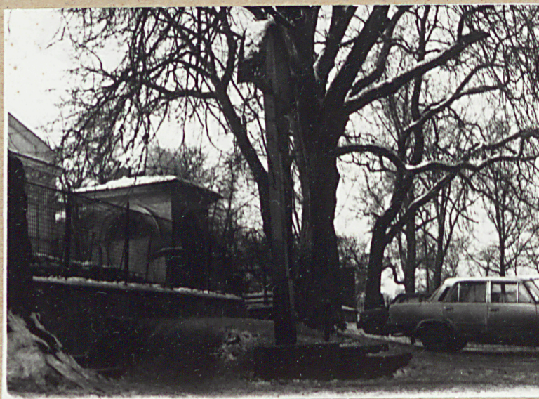
WIDOK NA PĘD CZĘŚĆ CMENTARZA Z KAPLICZKI ŚW. JANA