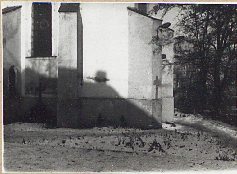
WIDOK OD PĘD-WSCHODU - DO NAGROBKU ANTONIEGO JORDY + 1831