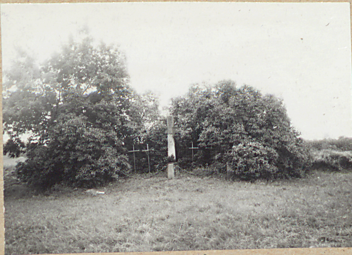
WIDOK OGÓLNY Z PÓŁNOCY