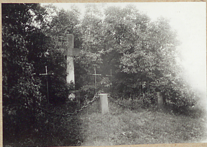
WIDOK Z PÓŁNOCY