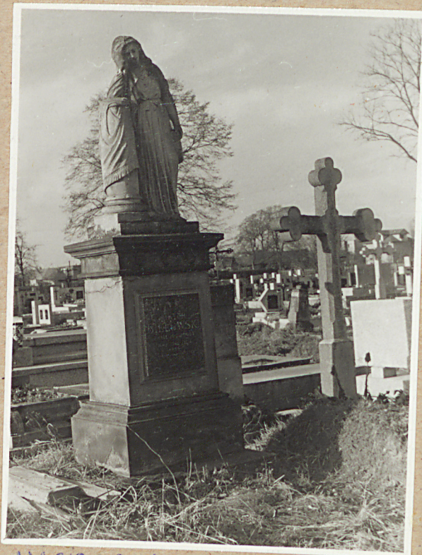
NAGROBEK WILHELM BIESIADKOWSKI +1900