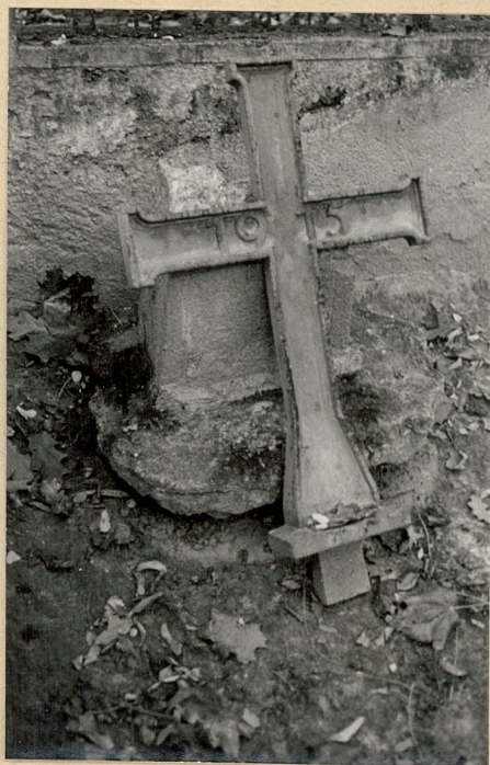
2. Zniszczony krzyż nagrobny