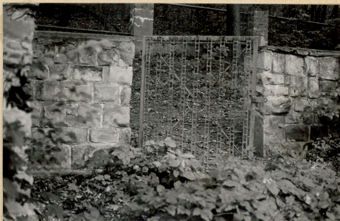
4. Brama metalowa