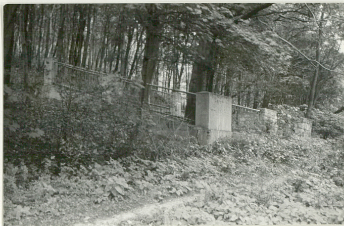
5. Widok ogólny