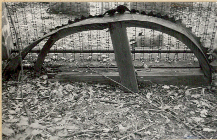
1. Fragment krzyża cmentarnego