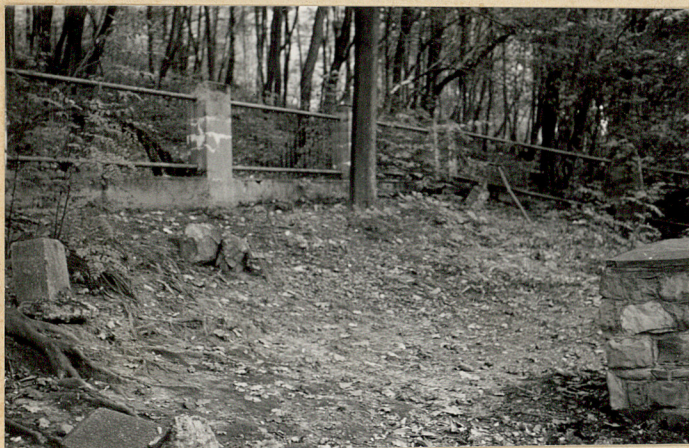
3. Widok ogólny