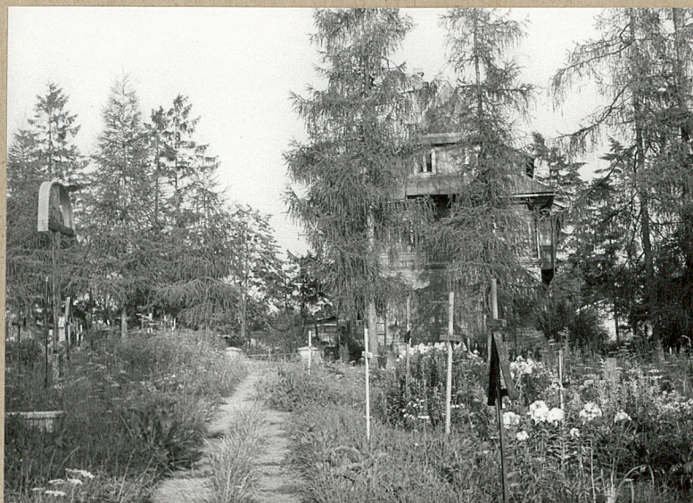
7. ALEJKA W STRONĘ WSCH.