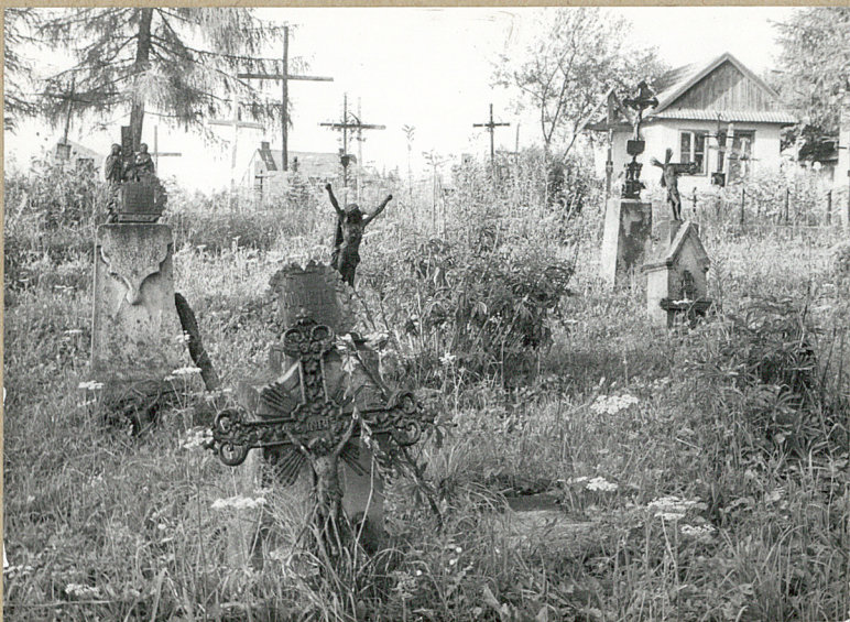
6. STRONA PN-WSCH.