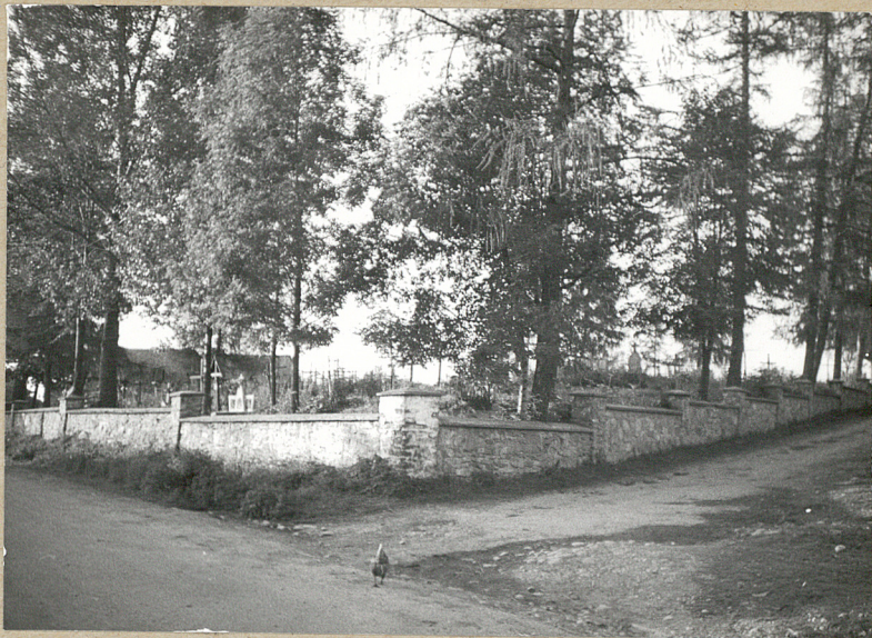
1. WIDOK Z SZOSY OD PD-WSCH.