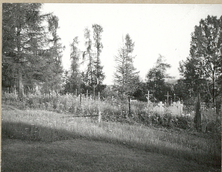
3. WIDOK OD PN.