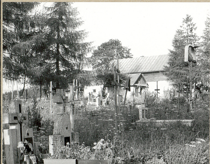
4. STRONA WSCH.