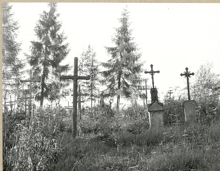
5. KRZYŻE ŻEL. Z POCZ. XX W.