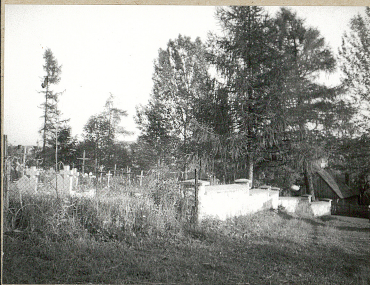
2. NA ROŻNIK PN-ZACH.