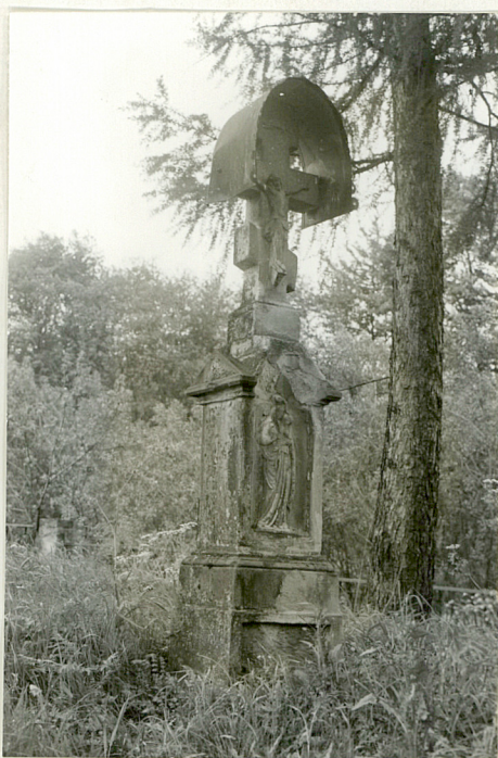
7. Nagrobek z piaskowca z k. XIX w.