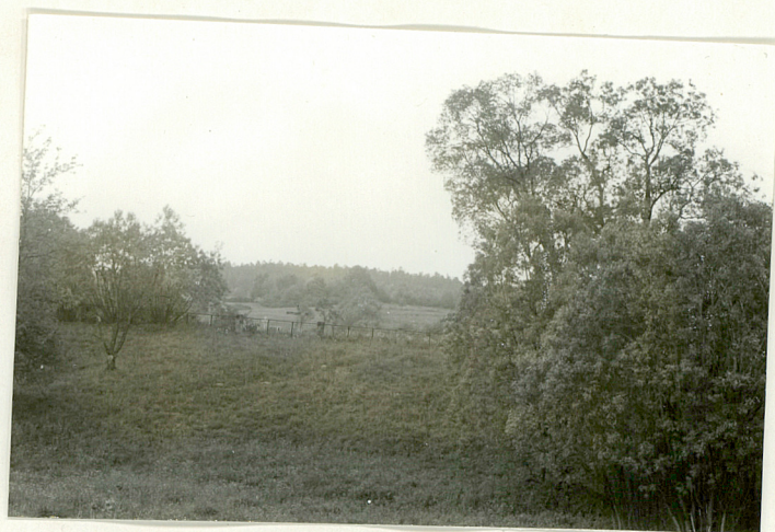
9. Widok ogólny