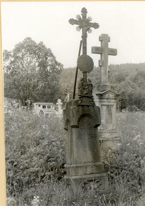
2. Nagrobek z krzyż.żel. z 1888r./napisów brak/