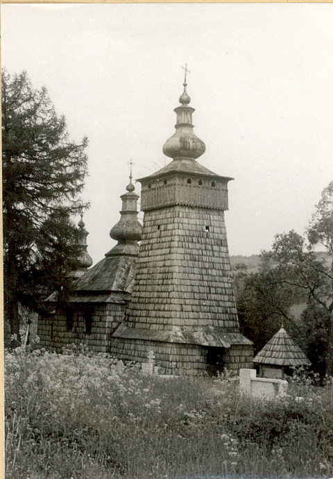
1. Cerkiew drewniana