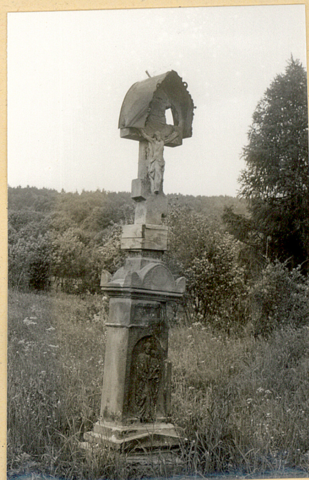
4. Nagrobek kamienny z k.XIX w./napisów brak/