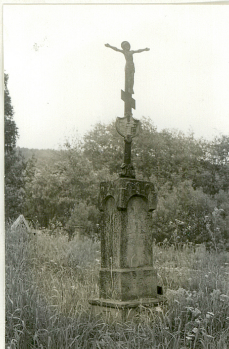
6. Nagrobek z piaskowca z 1894r.