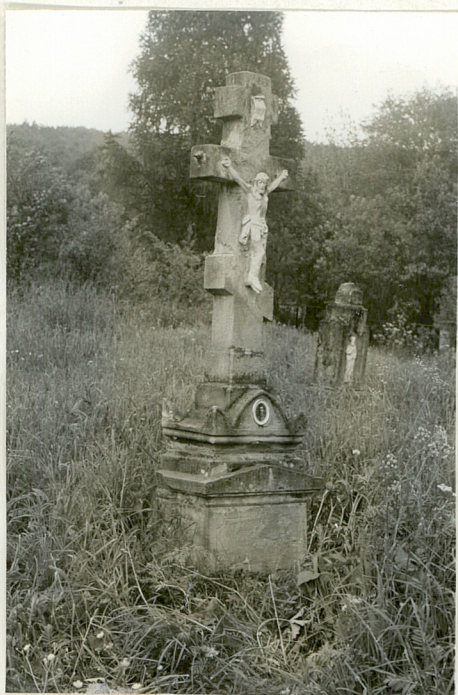
5. Nagrobek z piaskowca z k. XIX w.