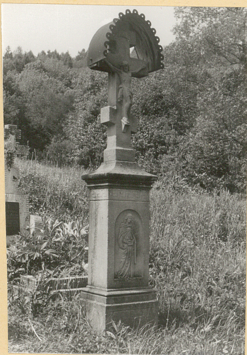
1. Krzyż kamienny z k.XIX w. /napisów brak/