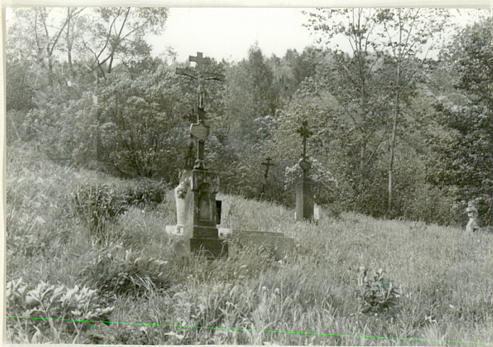
7. Widok ogólny