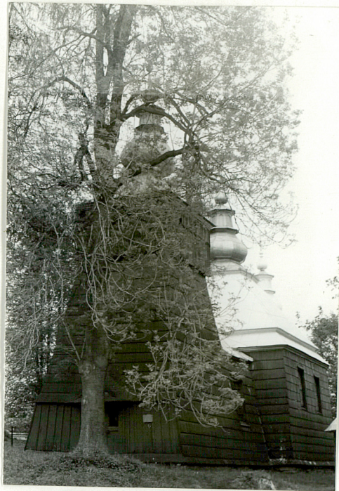
9. Cerkiew drewniana