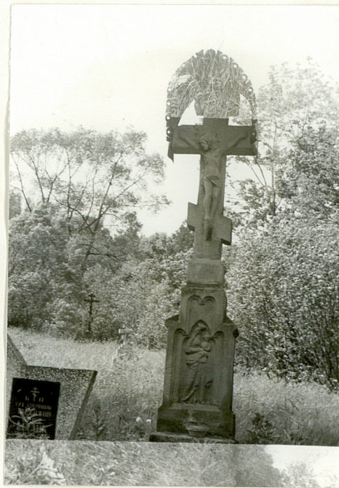
6. Krzyż kamienny z k. XIX w. /napisów brak/