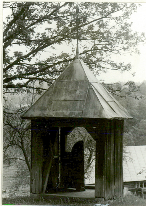
8. Budynek bramny przy cerkwii