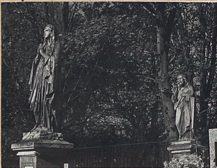
NAGROBKI AGNIESZKI I SZCZEPANA MROZIKÓW +1925 +1924