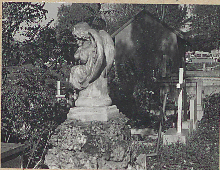
NAGROBEK ELWY ZIEGŁI +1895