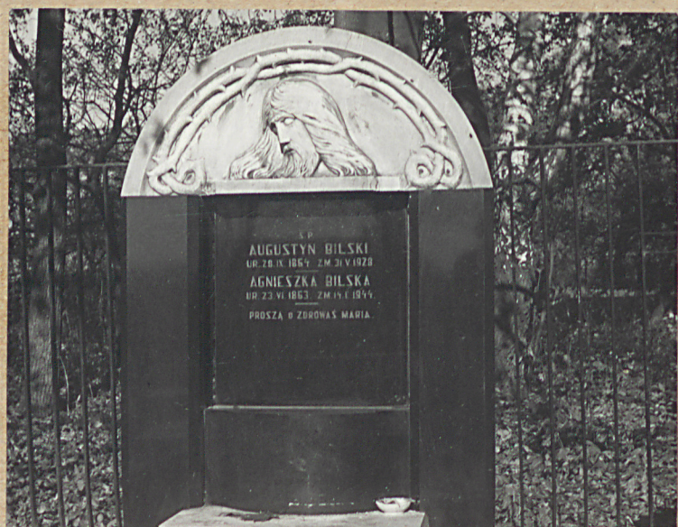
NAGROBEK BILSKICH +1928