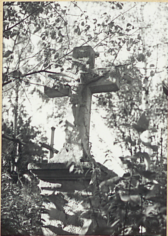
15. NN KRZYŻ KAMIENNY