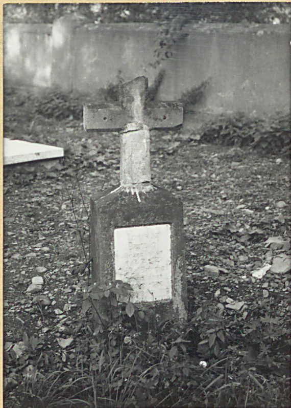
16. TOMASZ BARGIEŁ 1922