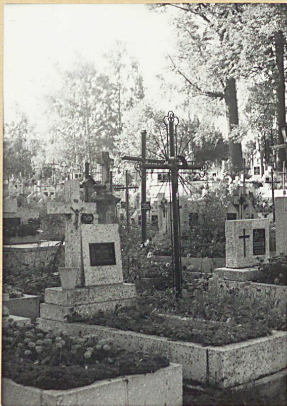
18. WIDOK OGÓLNY WNETRZA