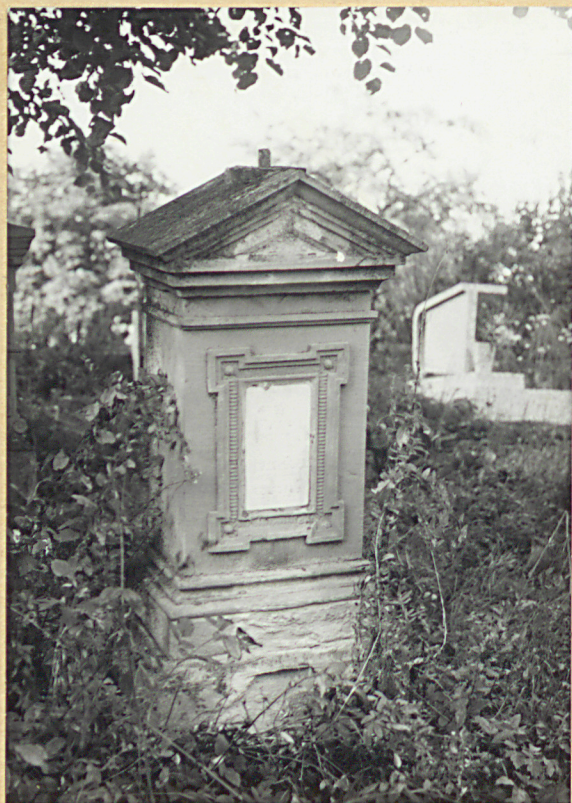
14. ZOFIA NAJBLANIEC 1923