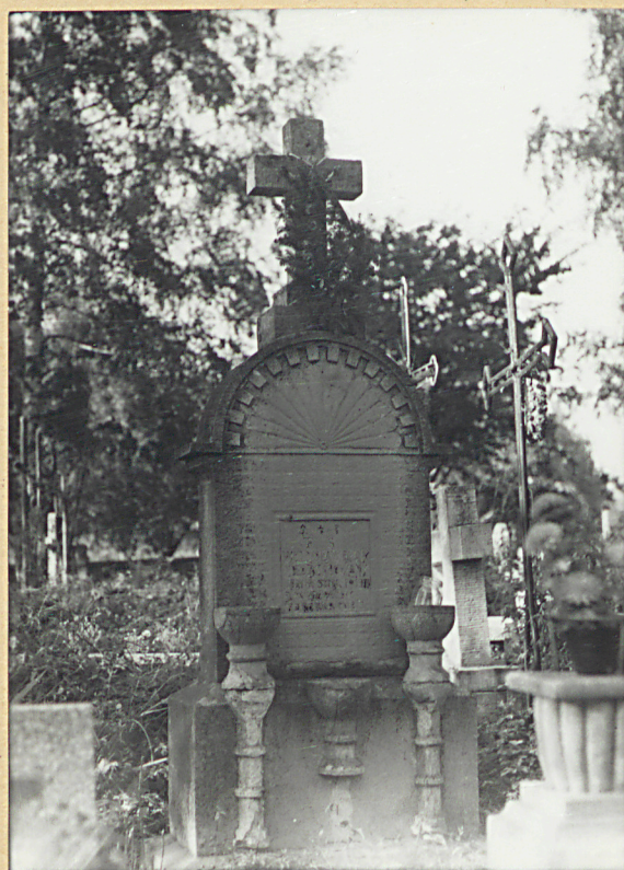
9. WŁADYSŁAW PAJĄK 1936