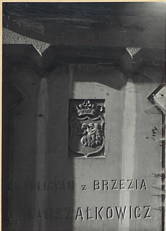
4. FRAGMENT NAGROBKĄ FELICYAN z BRZEZIA MARSZAŁKOWICZ 1870