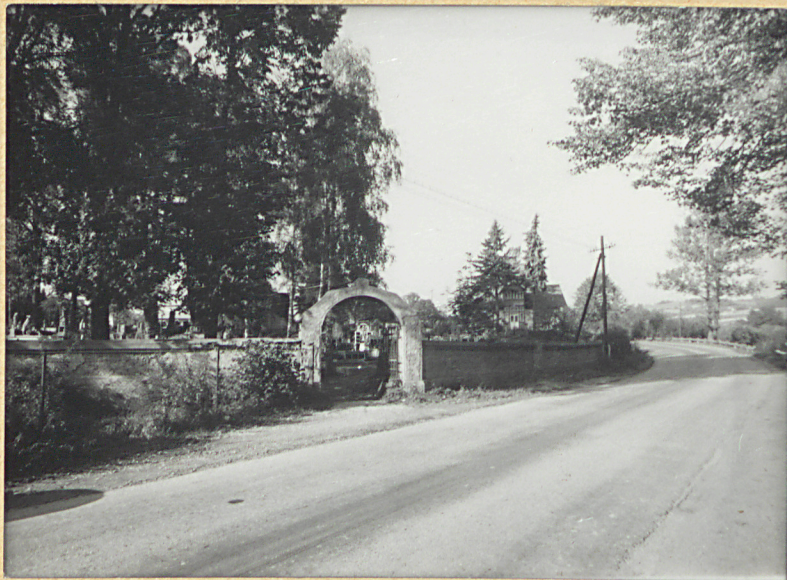
1. WIDOK OD SZOSY