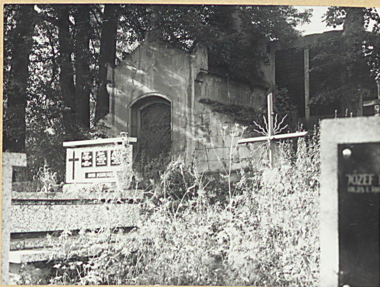
2. KAPLICA GROBOWA ŻUK-OKARŚZEWSKICH