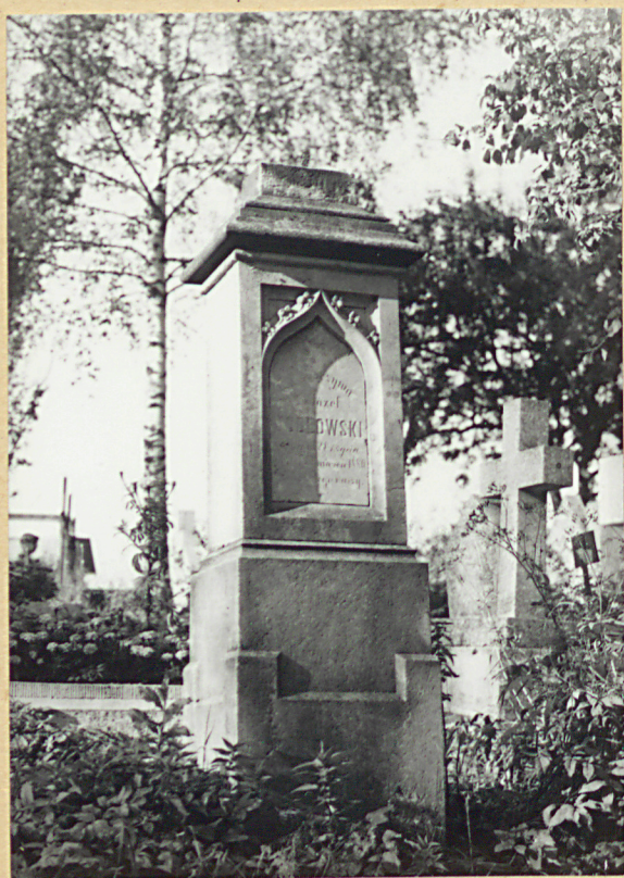
6. JOZEF JODEFOWSKI 1880