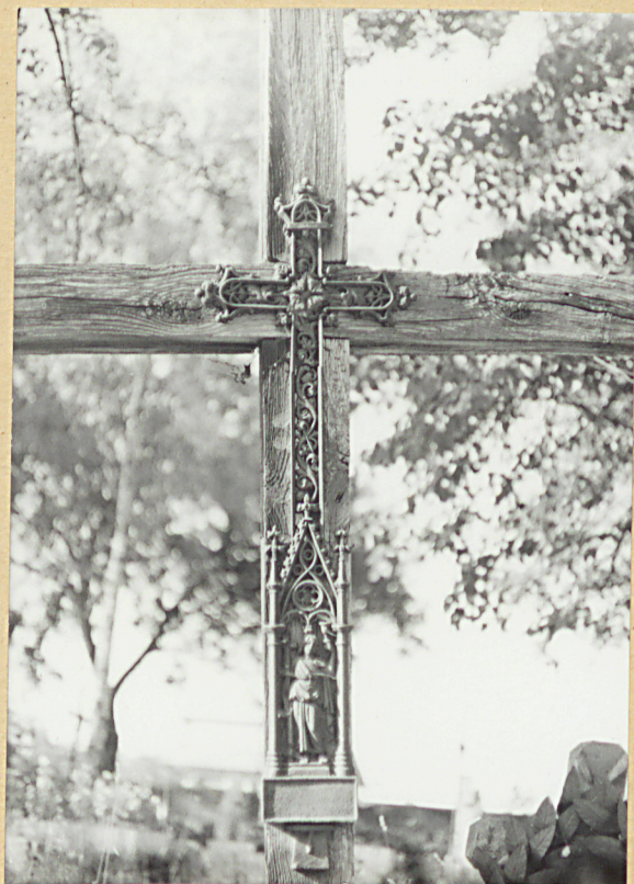
11. KRZYŻ ŻELIWNY NIESYGNOWANY