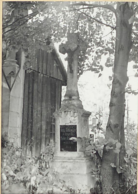
13. ANNA RAKOWSKA 1908