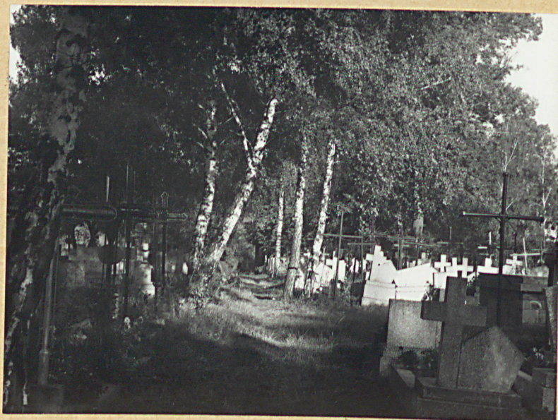
3. WIDOK ALI BRZOSZOWEJ