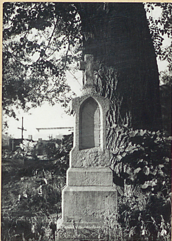
5. ZYGMUNT z BRZEZIA MARSZAŁKOWICZ 1878