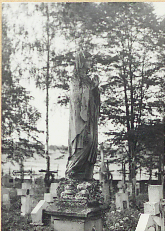
12. FIGURA MATKI BOSKIEJ, PIASKOWIEC