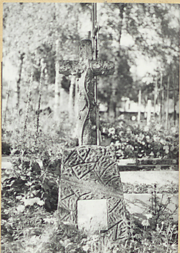
10. AGNIESZKA BIEDRONIOWA 1938