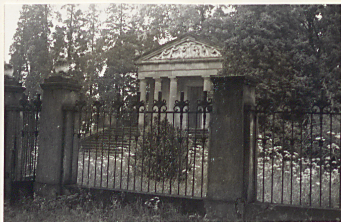
31. Ogródenie kaplicy