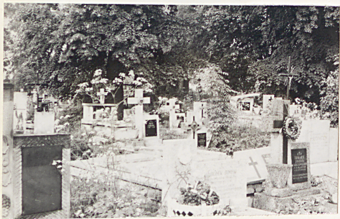
28. Widok ogólny