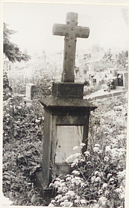
23. Nagrobek - Józef Konieczny k. XIX w.