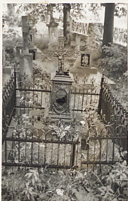
7. Nagrobek - Jarosław Schimner z k. XIX w.