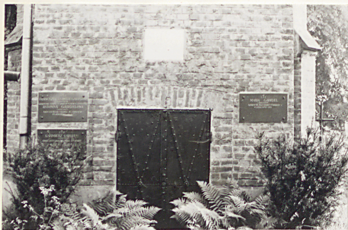
15. Kaplica mur. z 1896r.