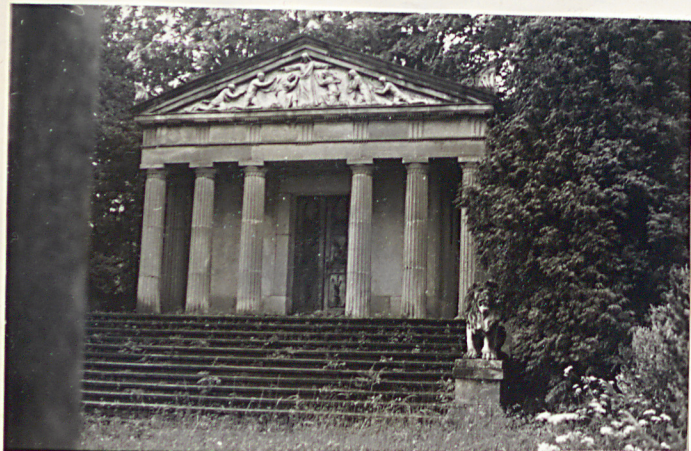
30. Kaplica grobowa Rodziny Długoszków właścicieli Siar XIX w.