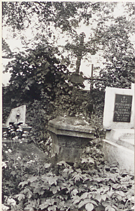
16. Nagrobek z k. XIX w.