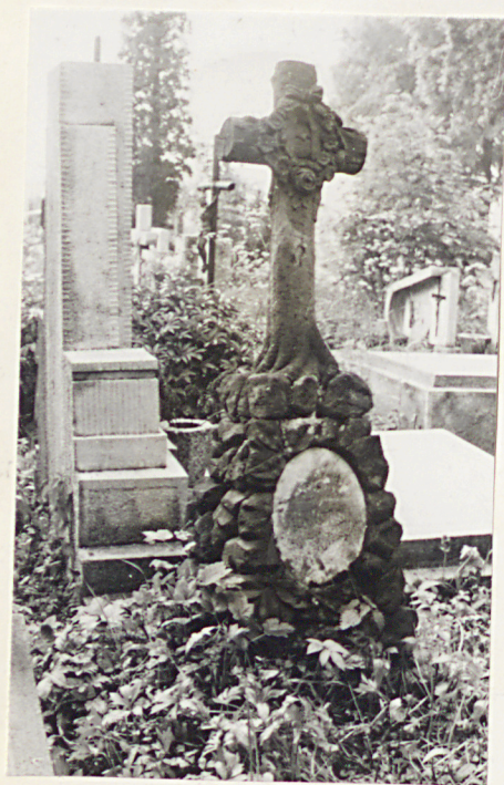
18. Nagrobek nieczytelny napis/ K. XIX w.