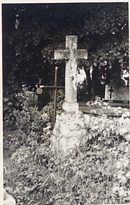
26. Nagrobek - napis nieczytelny k. XIX w.