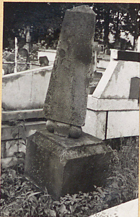
1. Nagrobek - Antoniego. Twardzickiego + 1881r.