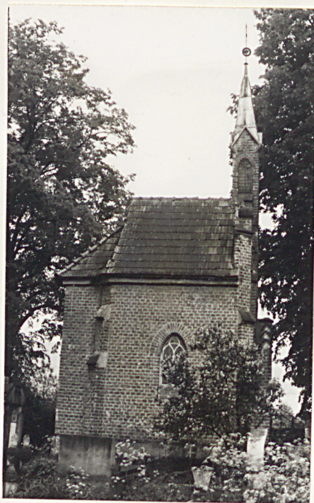
15.a. Kaplica Kostyalów, Gabryelów