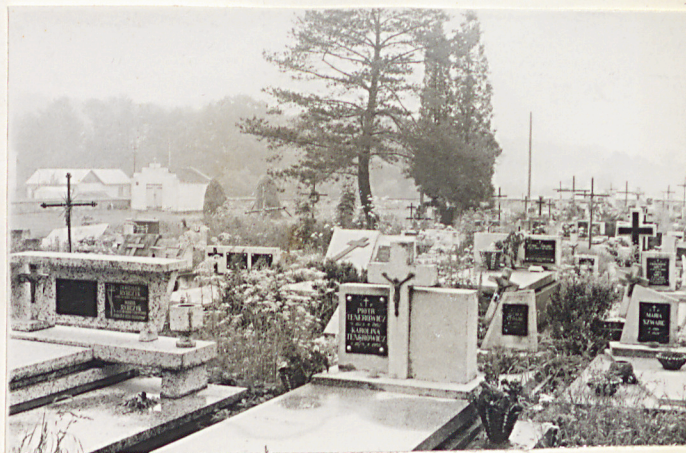
29. Widok ogólny