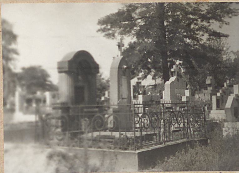
NAGROBKI: X. WŁADYSŁAWA MENDYKA +1934 MARII MENDYKOWEJ +1920