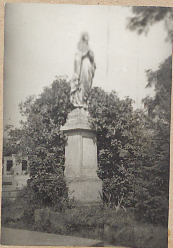
NAGROBEK LESNIAKÓW +1815