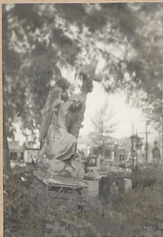
NAGROBEK MARII KONOPKOWEJ +1885