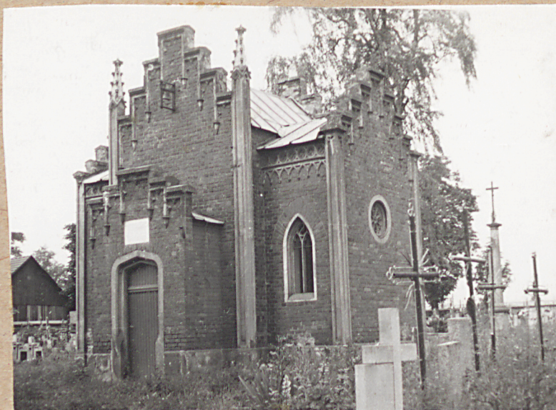
KAPLICA GROBOWA KIRCHMAYERÓW