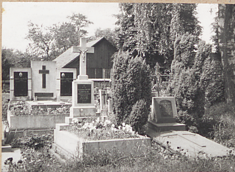
GROB ks. GORALIKA +1964