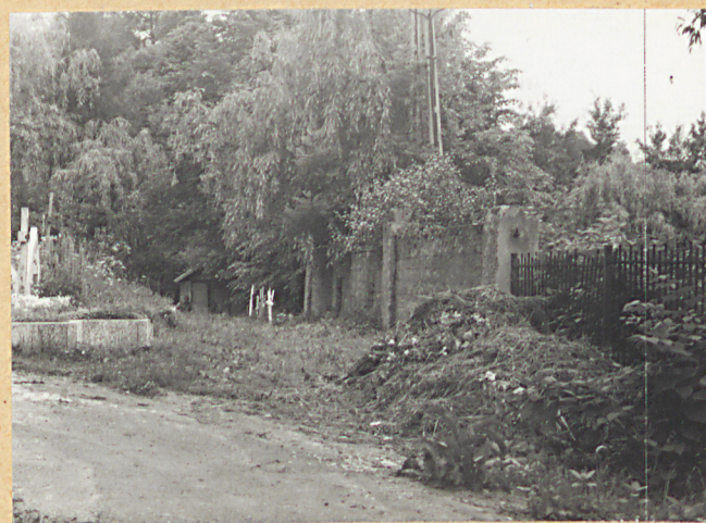
3. STRONA PN.