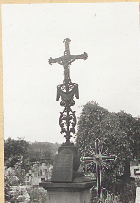
8. HELENA ZAJĄCZKOWSKA 1874