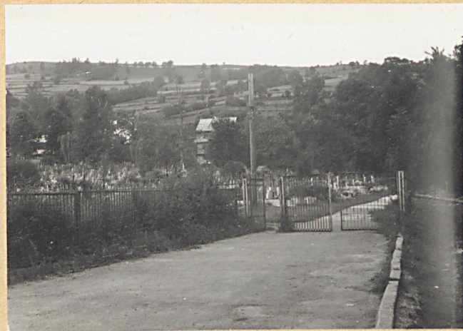
1. WEJŚCIE NA CMENTARZ