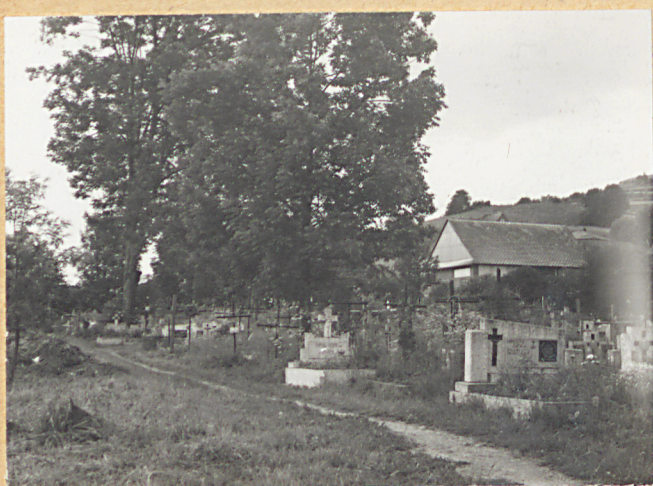
2. STRONA WSCH.