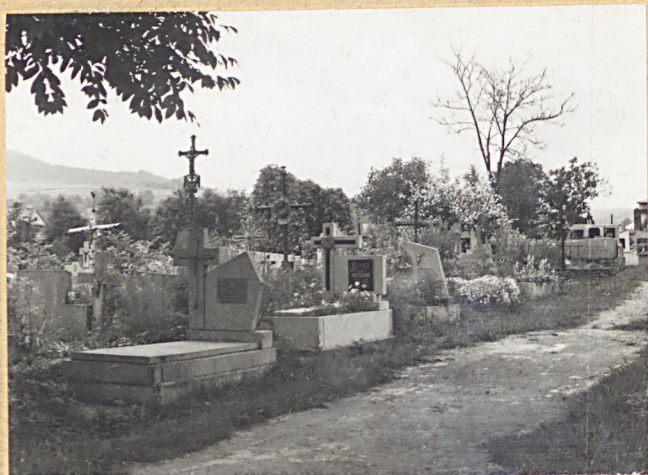
6. ALEJA W CZĘŚCI PN.