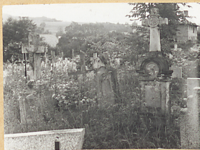
5. NAGROBKU NN: 1883, 1906