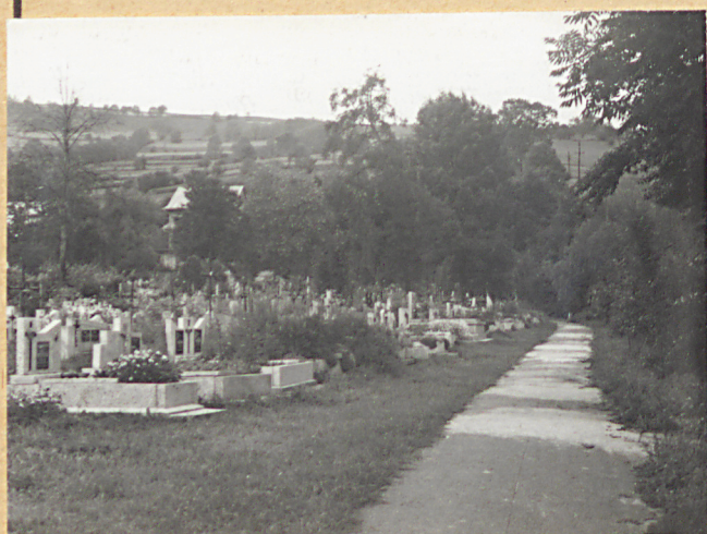
4. ALEJA OD BRAMY