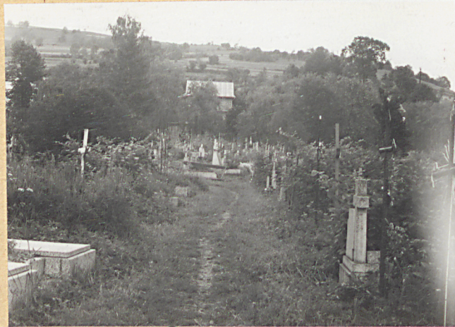
7. STRONA PD. - WSCH.