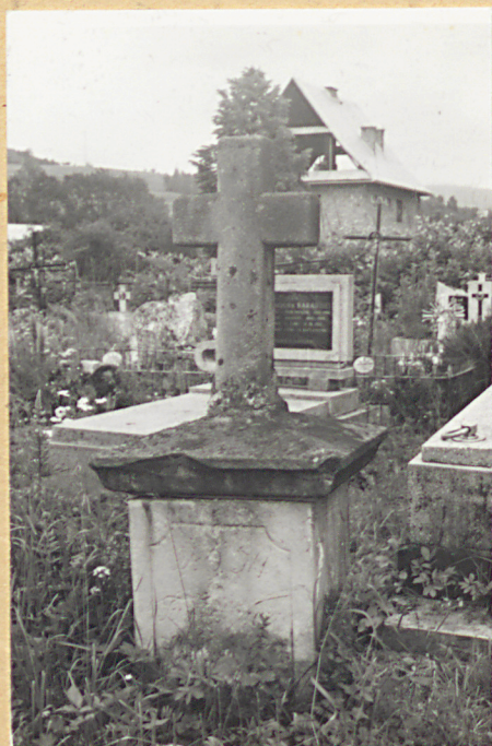
10. MARYANNA KRZACZ 1851