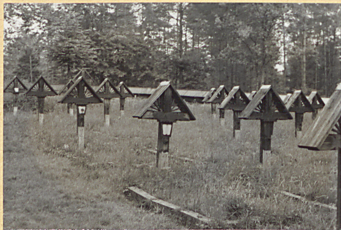
2. Kwatera lewa