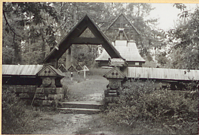
4. Widok ogólny