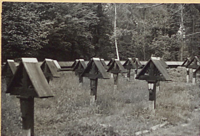
3. Kwatera prawa