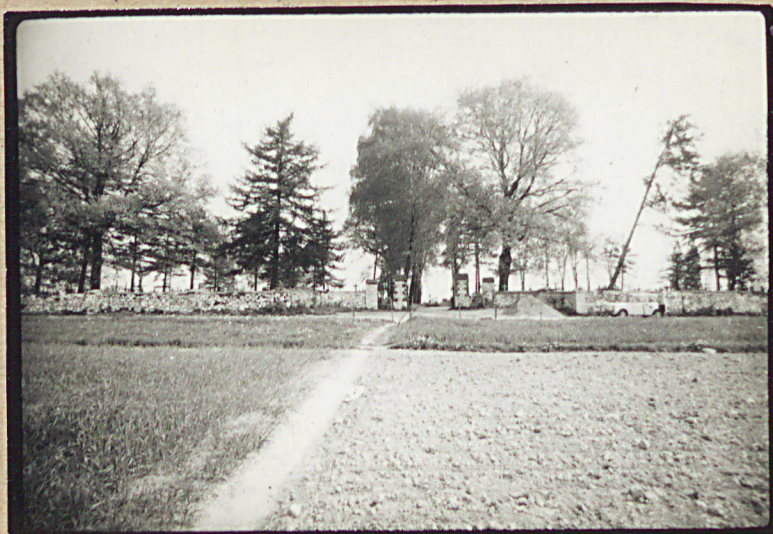
WIDOK Z MENTA R24