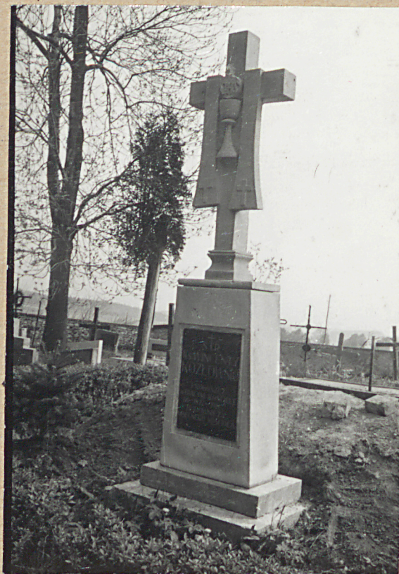
NAGROBEK X. WINCENTEGO KOZŁOWSKIEGO +1918