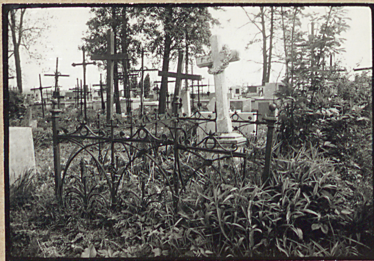
NAGROBEK LUDWIKA ŁASEKIEGO +1877