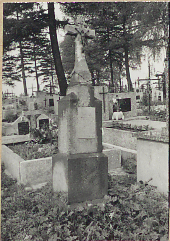
NAGROBEK WOJCIECHA WIERZBIŃSKIEGO +1930