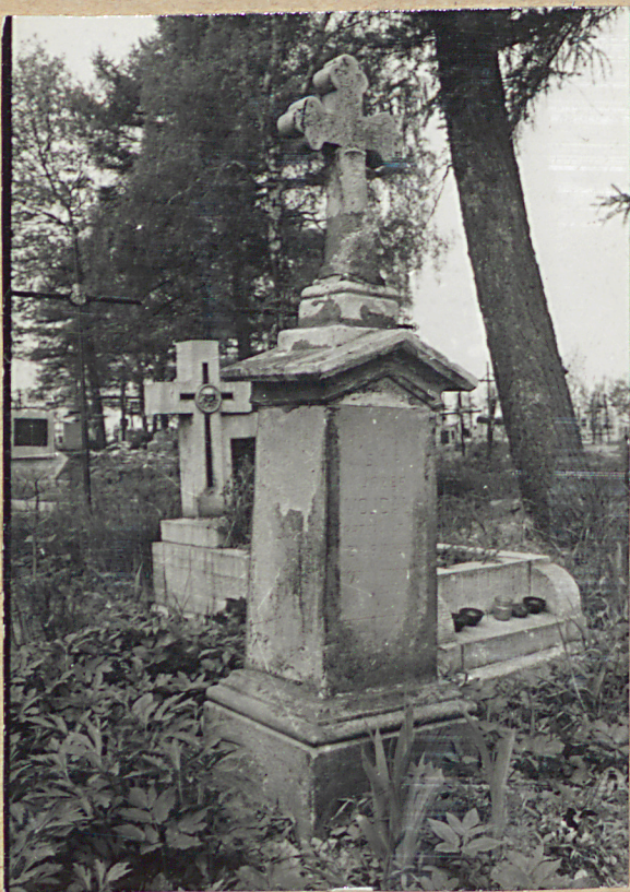
NAGROBEK ZBIEŻA WOJDAŹY +1934