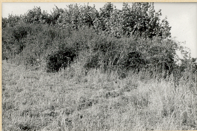
3. Widok ogólny