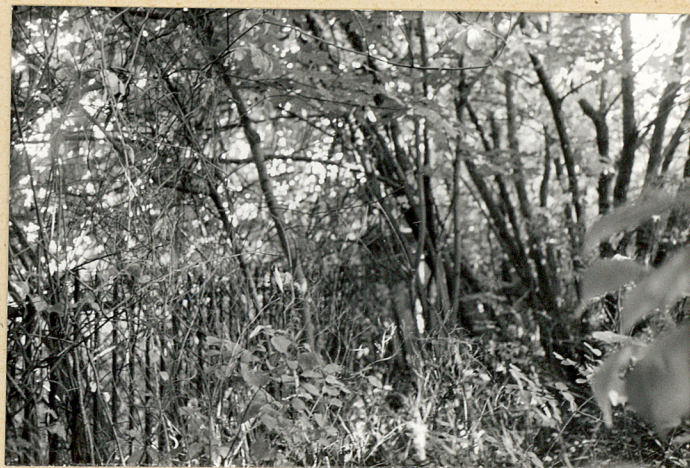
2. Widok ogólny