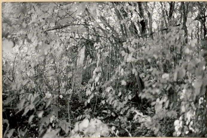
1. Widok ogólny