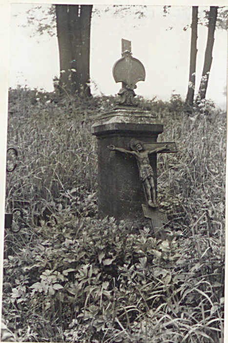
13. Nagrobek z krzyżem żel. z k. XIX w.