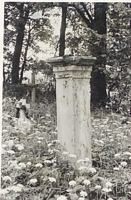
17. Nagrobek uszkodzony z k. XIX w.