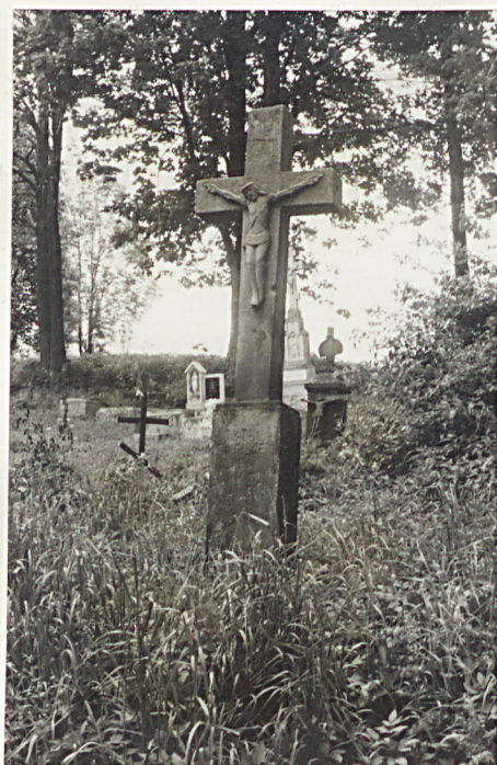
14. Krzyż kamienny Petro Senjuk + 1907r.