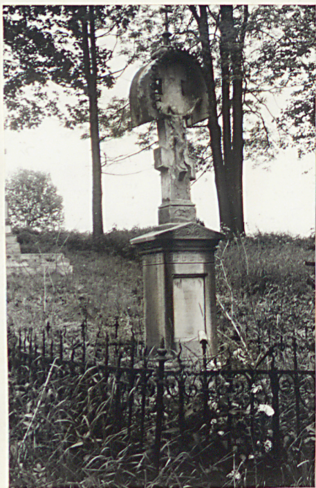
11. Krzyż kamienny z k. XIX w.