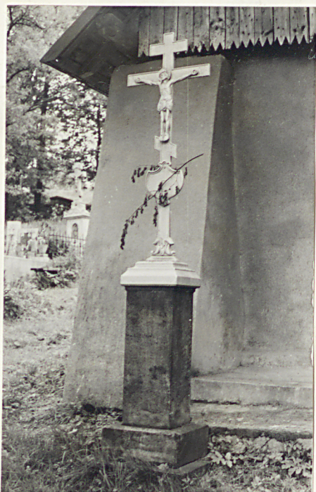
21. Nagrobek z krzyżem żel. z k. XIX w.