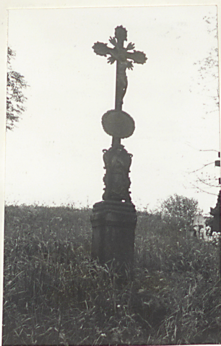
8. Nagrobek z krzyżem żel. z k. XIX w.