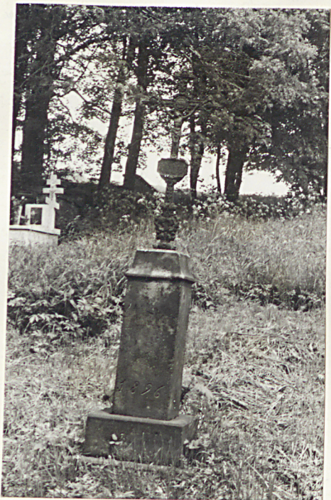
5. Nagrobek z krzyżem żel. z 1896r.