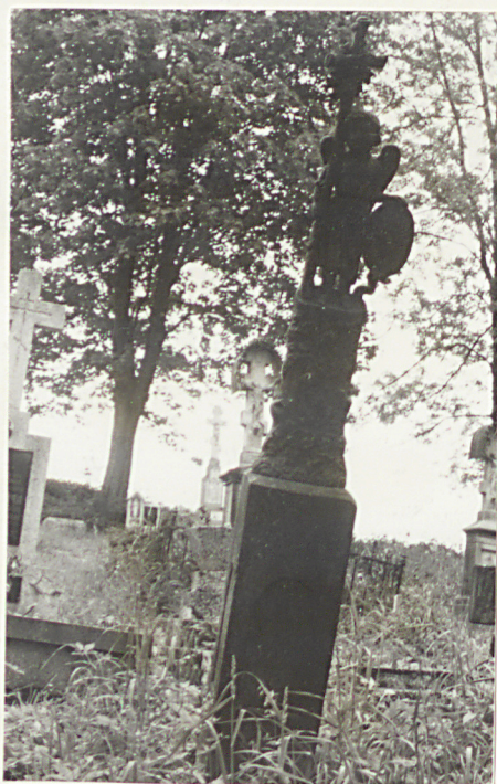
19. Nagrobek z krzyżem żel. z k. XIX w.