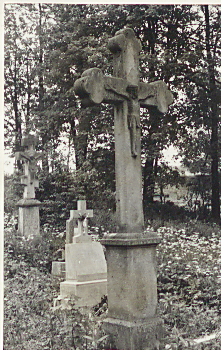
20. Krzyż z piaskowca z k. XIX w.