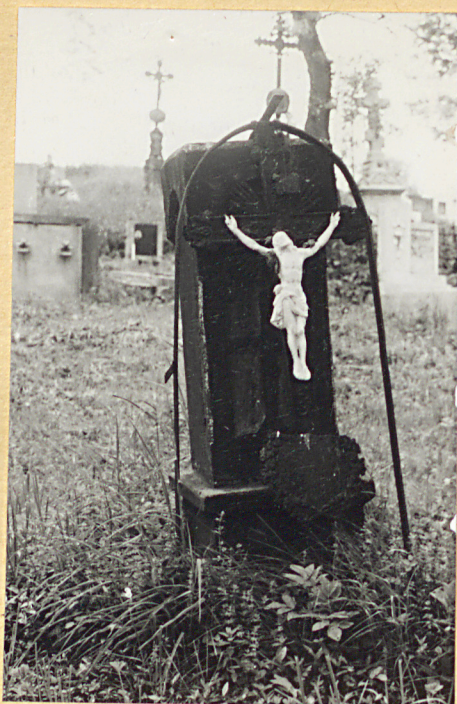
2. Uszkodzony nagrobek z k. XIX w.