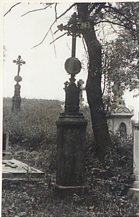
6. Nagrobek z krzyżem żel. z 1896r.