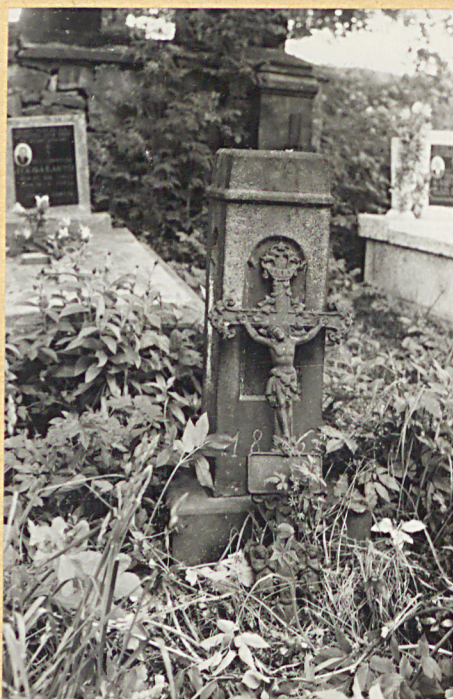
1. Uszkodzony nagrobek z 1896r.