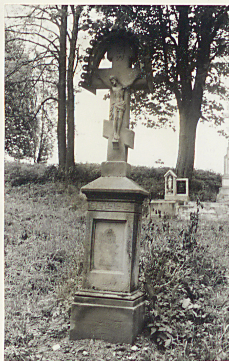
12. Krzyż kamienny z 1912r.