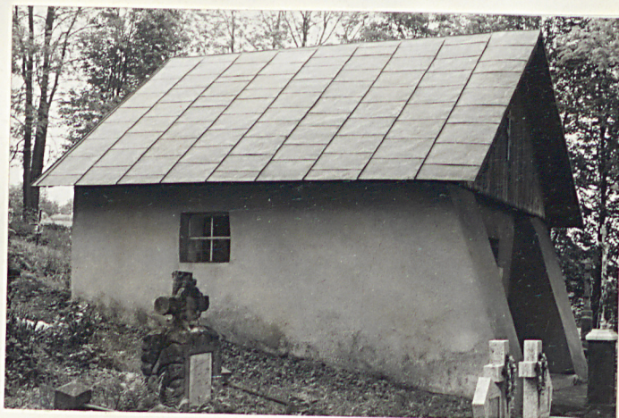
22. Kaplica cmentarna mur.