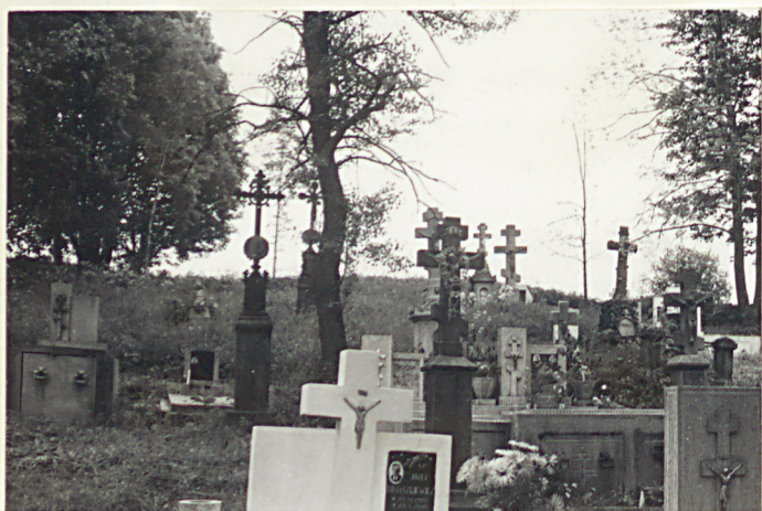
23. Widok ogólny