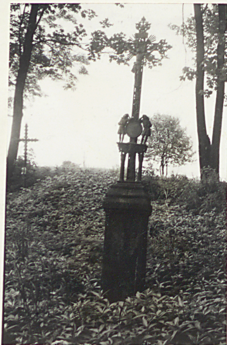
15. Nagrobek z krzyżem żel. z 1888r.