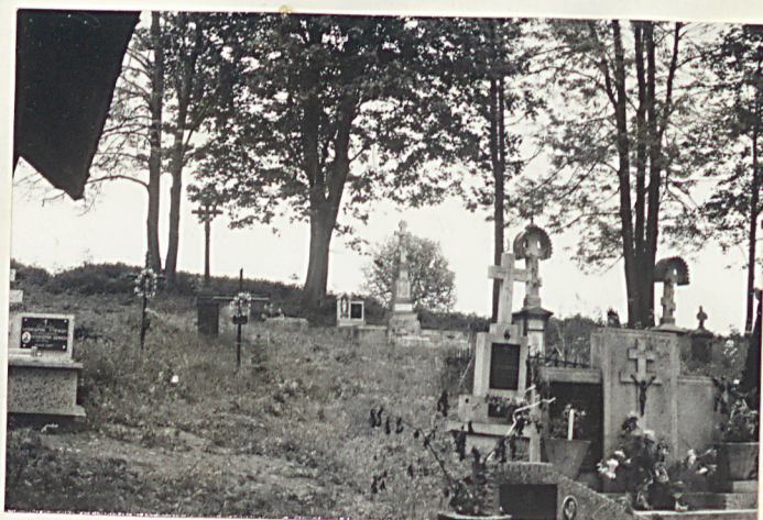
24. Widok ogólny