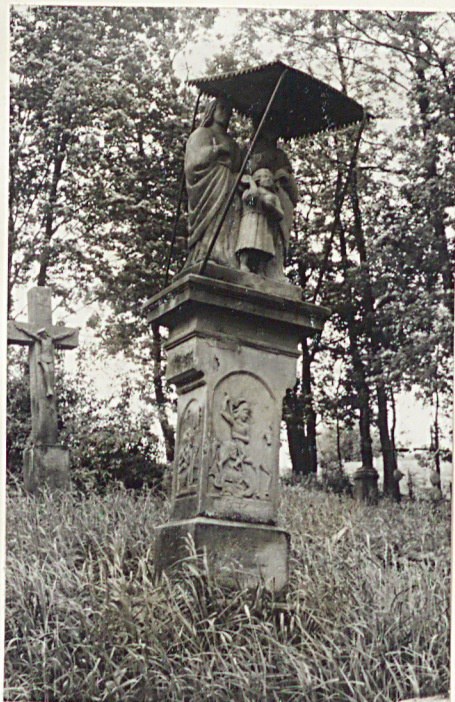
16. Nagrobek z piaskowca Orest Gyra + 1902r.