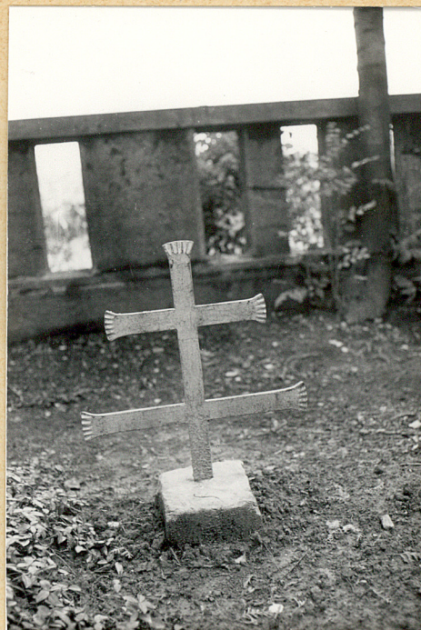
2. Krzyż żel.