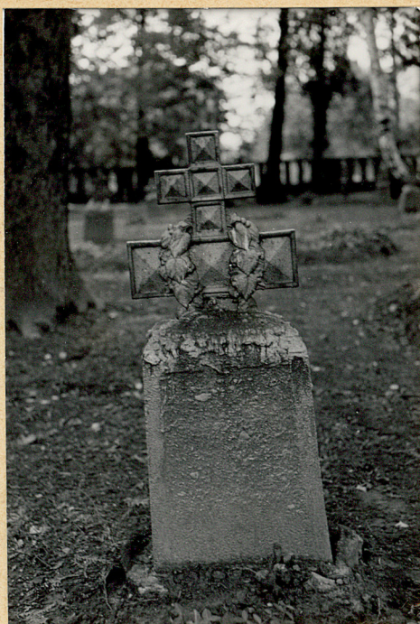
1. Krzyż żel.