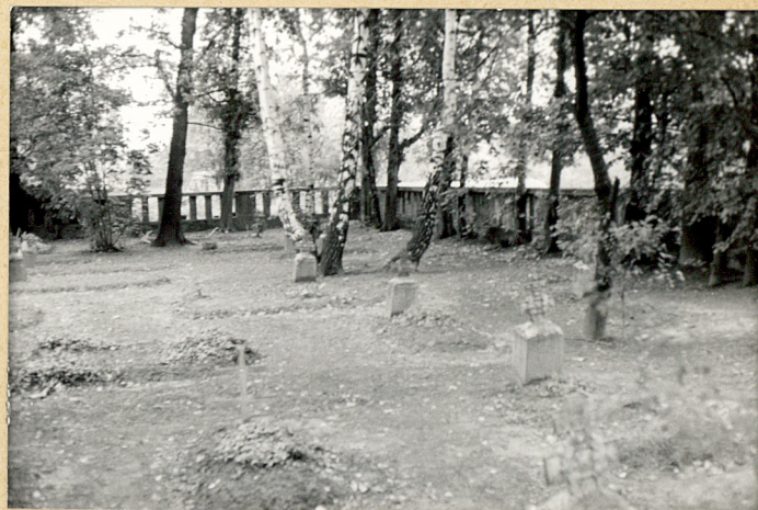
4. Widok ogólny