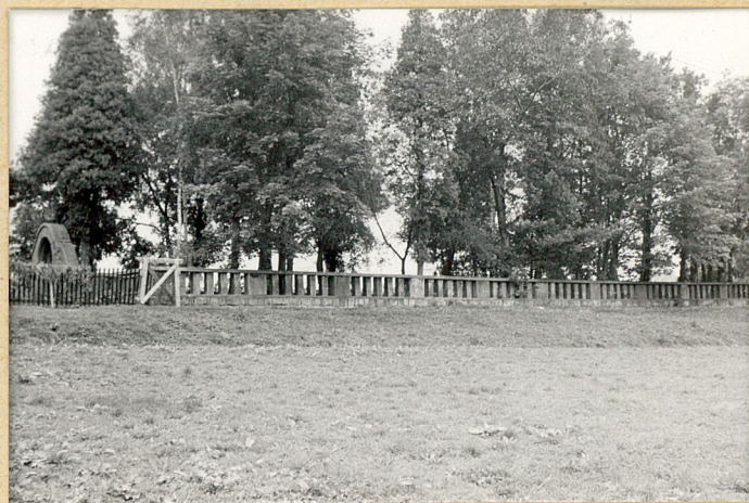
6. Widok ogólny