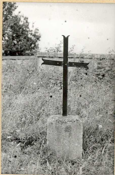
2. Krzyż żel.