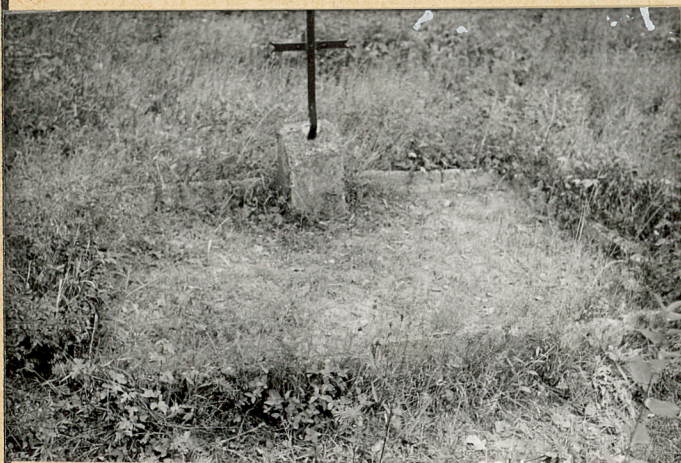
3. Mogiła zbiorowa