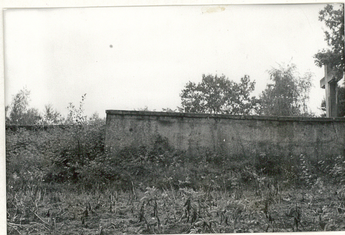
6. Widok ogólny.