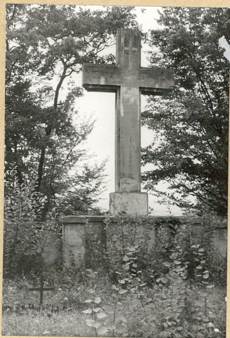
1. Krzyż betonowy