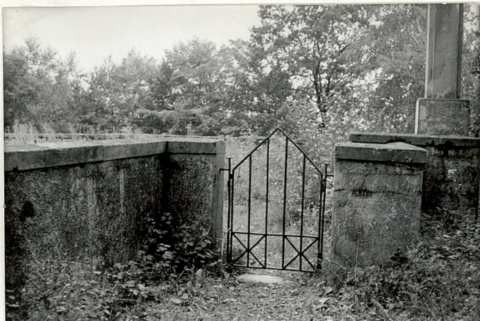
5. Brama metalowa