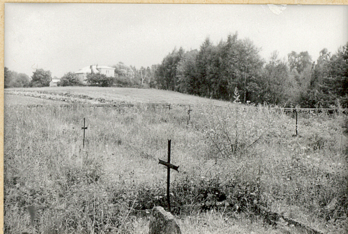
4. Widok ogólny.