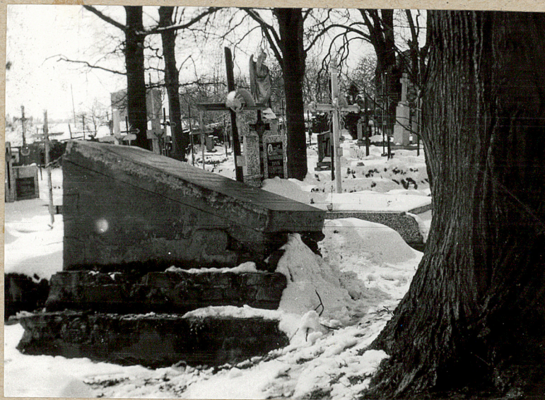
NAGROBEK KATARZYNY GRZYBOS + 1907