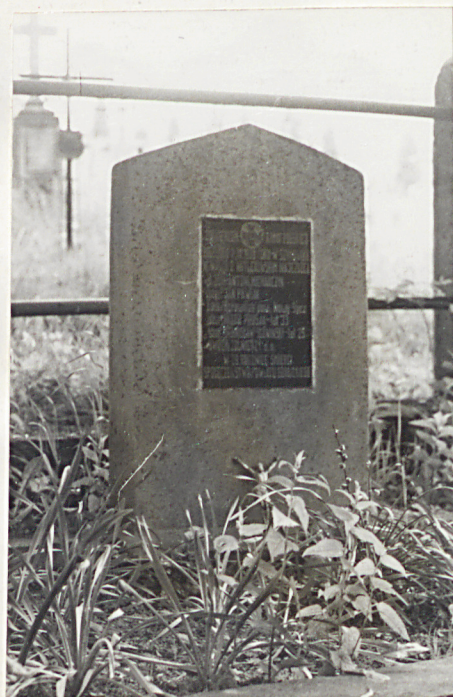
6. Nagrobek na mogile zbiorowej