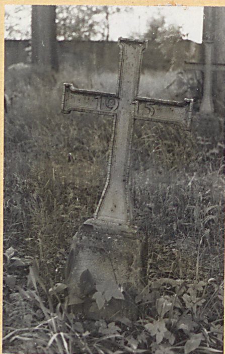
1. Krzyż metalowy