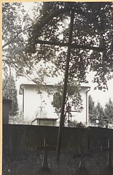
4. Krzyże metalowe