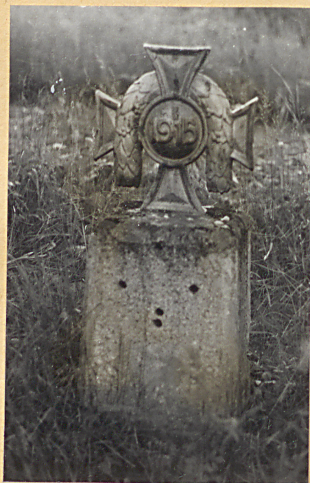
2. Krzyż metalowy