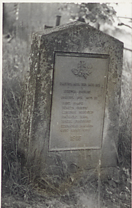
5. Nagrobek na mogile zbiorowej