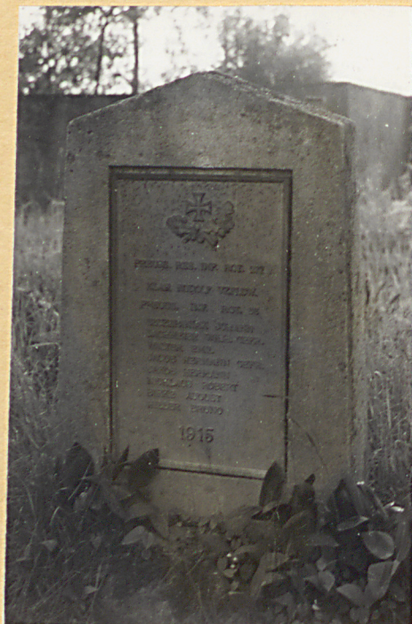
3. Pomnik na mogile zbiorowej