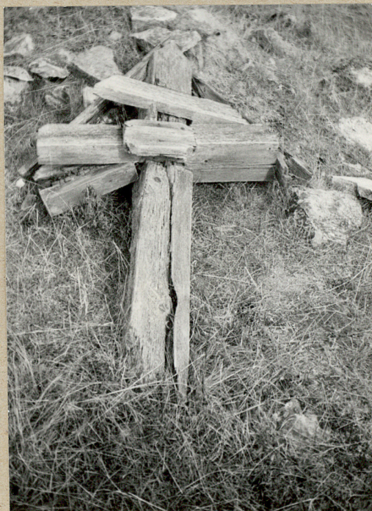
3. FRAGMENTY DREWNIANE- GO KRZYŻA