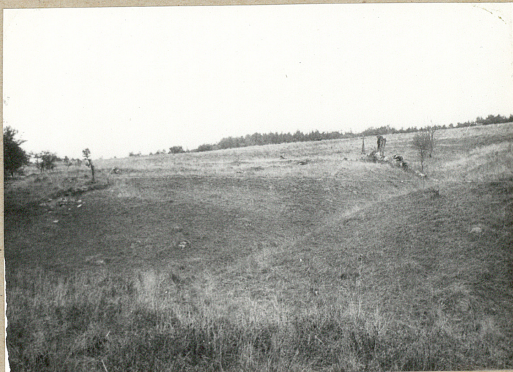
1. WIDOK Z DROGI