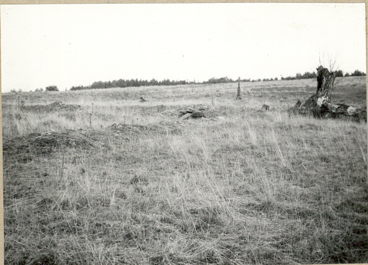
2. WYPALONY KŁOS DRZEWA NA GRANICY CMENTARZA