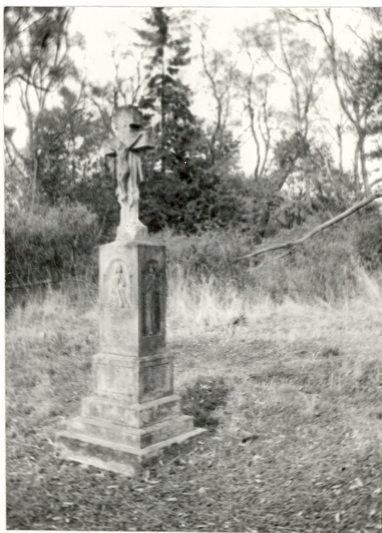
11. NN, 1901