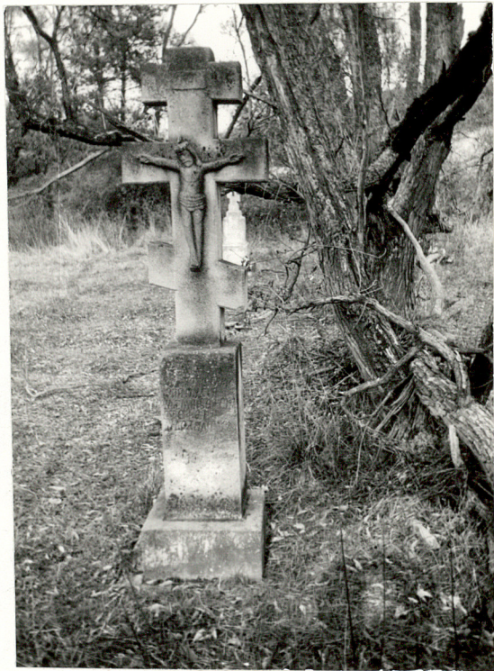
9. NN, 1925