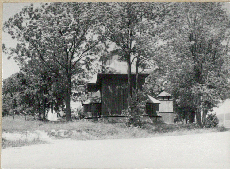
1. WIDOK NA CERKIEW Z DROGI