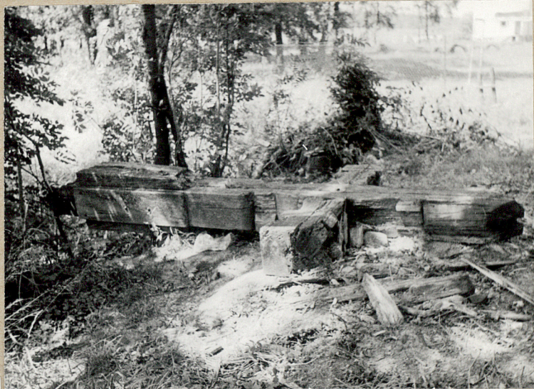
3. KRZYŻ DREWNIANY Z MOGILY