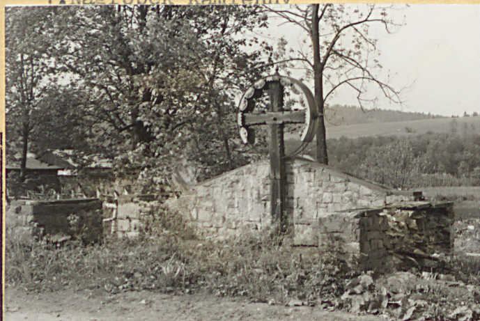
3. Widok ogólny