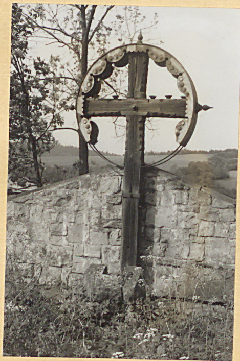
2. Krzyż drewniany