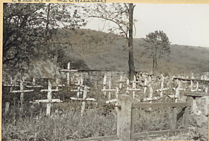
4. Widok ogólny