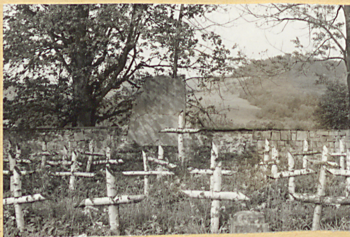
5. Widok ogólny