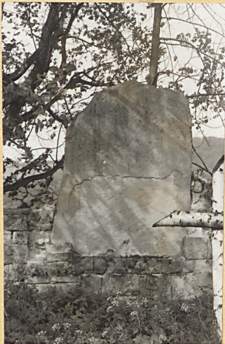
1. Nagrobek kamienny